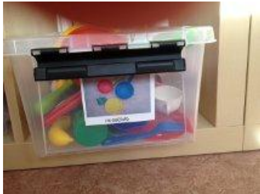
13. Bilder och text på alla lådor.