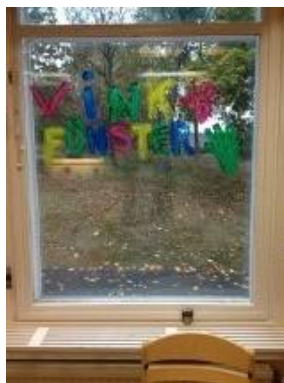
34. Vink fönster för barnen.