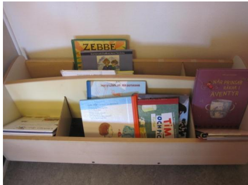
9. Ännu mer böcker som är lätta att använda för barnen.