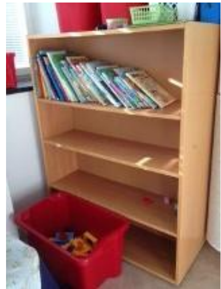
14. Böcker lätt tillgängliga för barnen.