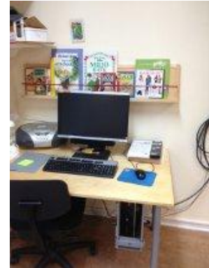
31. Dator för barnen och böcker.