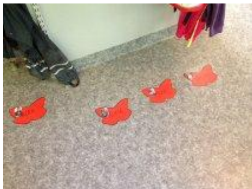
21. Istället för att ha barnens namn så högt sitter det på golvet.