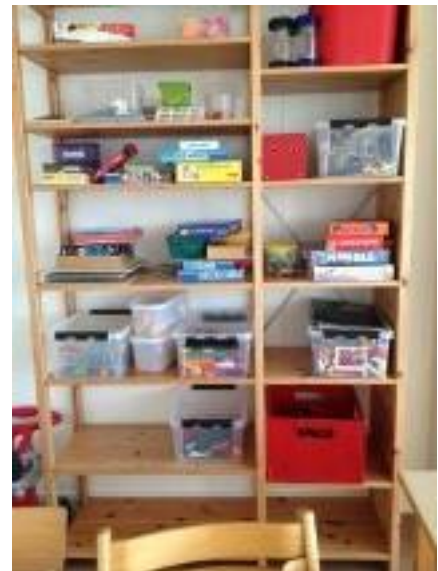
16. Spel som är lättillgängliga för barnen.