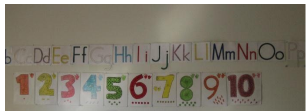
12. alfabetet utan hjälpande bilder sitter långt ner i ett annat rum.