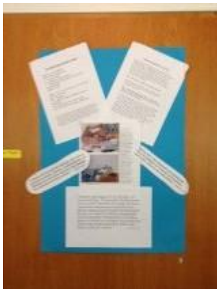
23. Dokumentationen på vad barnen gjort i en aktivitet sitter tydligt framme i bilder och text.