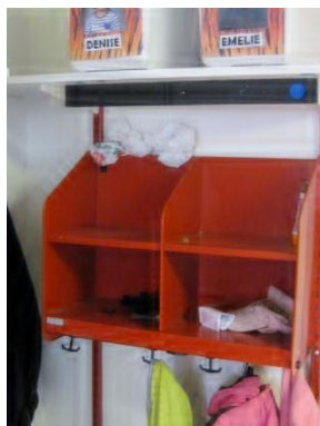
5. Barnens namn och foto.