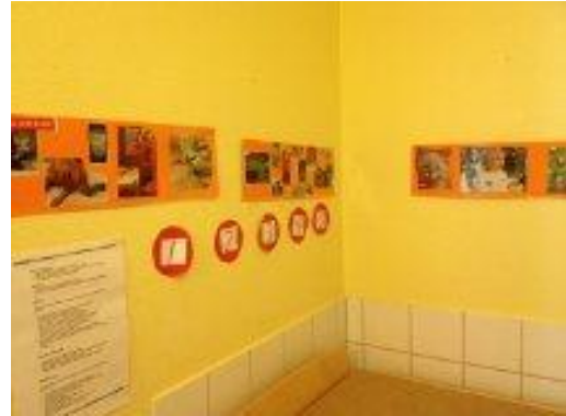
20. Bilder och texter sitter uppe ovanför skötbordet.