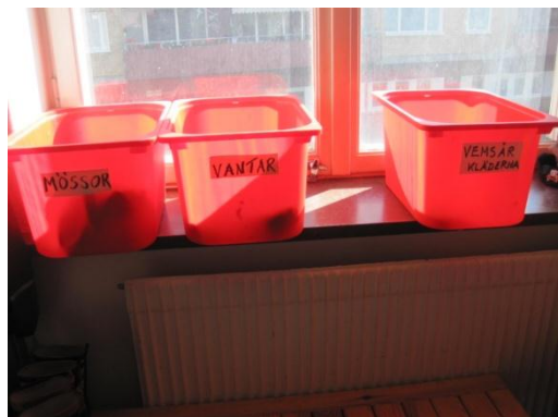
6. Text som beskriver vad det finns i lådorna.