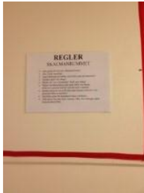
30. Ordnings regler. Vad gör man i rummet? Gjorda av barnen.