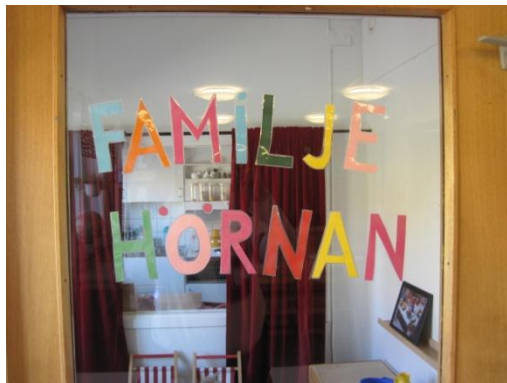
3. Mer text som beskriver vad detta rummet används till.