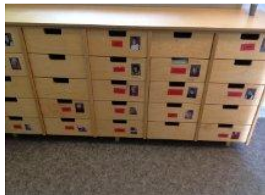
22. Foto och namn på barnens lådor.