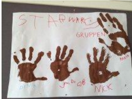
19. En grupp heter Star Wars gruppen. Här har de själva skrivit gruppens namn och deras namn.