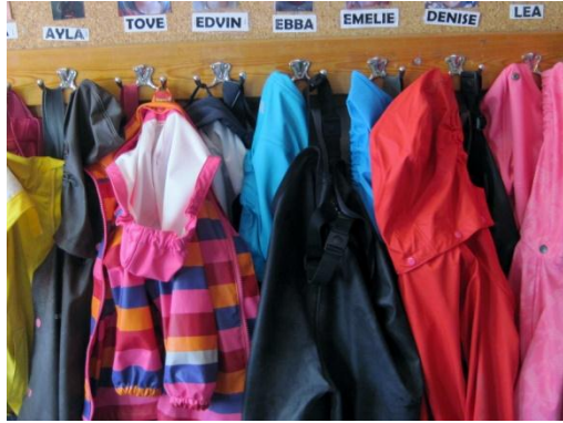
7. Foto och namn där regnkläderna hänger.