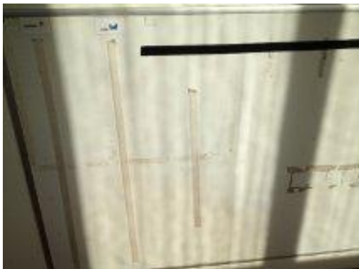
15. Tavla där barnens namn sätts upp.