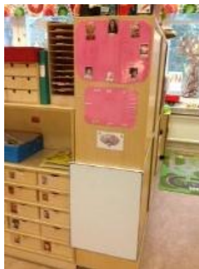
32. Foto och namn på vad barnen ska sitta.