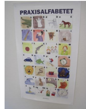
10. Plansch på hur bokstäverna låter sitter uppe.