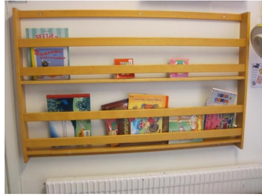
8. Böcker i bokhylla i barnens höjd.