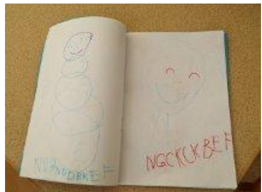
18. Egna målar och skrivböcker. Där barnen bl.a. skrivit vad de heter m.m.