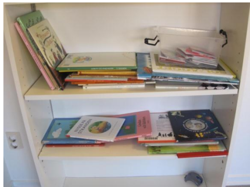
4. Böcker i bokhylla i barnens höjd.