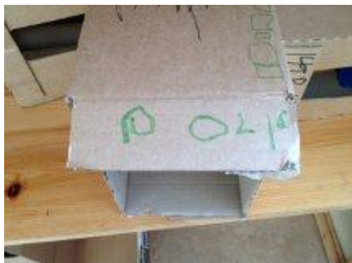
17. Barnen har skapat utav lådor. Det här är en polisstation.