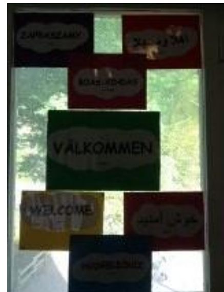
24. Välkommen på olika språk sitter uppe när man kommer in på avdelningen.