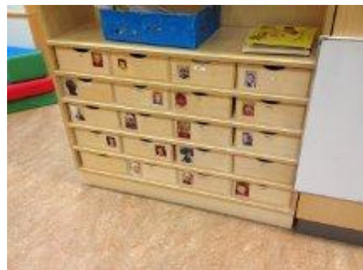
35. Foto och namn på barnen lådor.