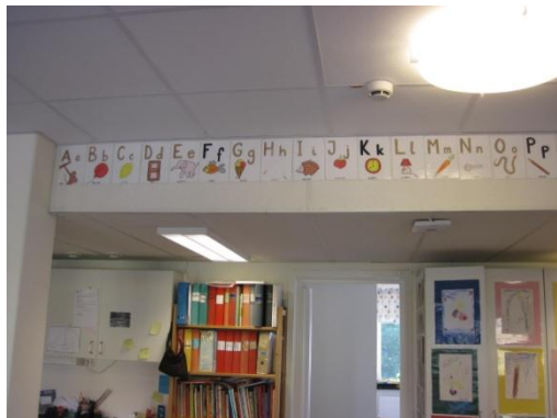
11. Alfabetet med bilder sitter högt upp på väggen i rum.