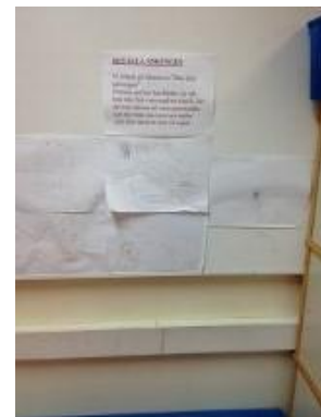
33. Dokumentation med barnens bilder och texter väl synliga för barnen.