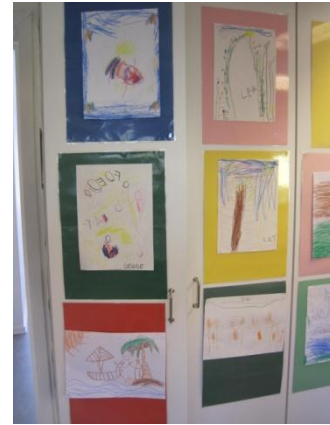
2. Barnens alster uppsatta på väggen med barnens namn skrivna av barnen själva.