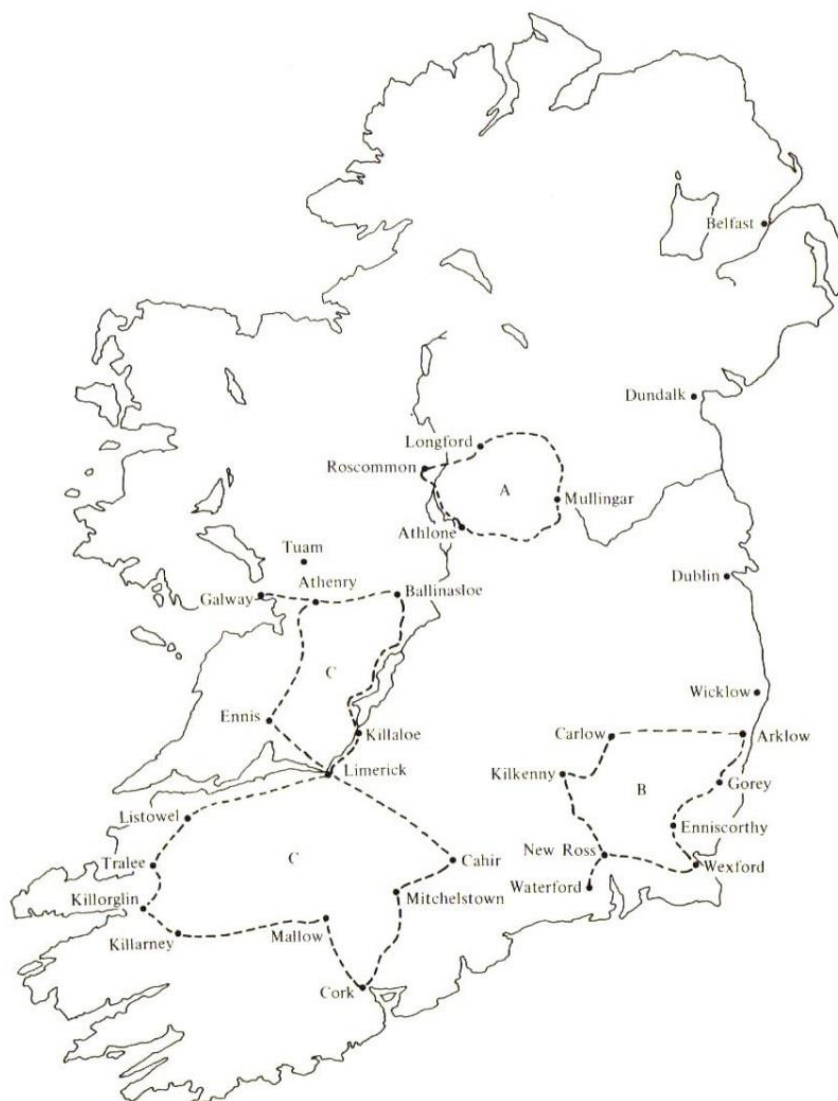
Figur 4. Tre olika familjers traditionella resruttn mönster. 174

I de flesta av regionerna på Irland förekom det (åtminstone så långt som in på 70-talet) en någorlunda jämn distribution av mindre byar och gårdssamlingar/småsamhällen med omkring 7 (11,27 km) till 10 miles (16,09 km) avstånd ifrån varandra, och mellan större orter (1000 till 5000 invånare) från 20 miles (32,19 km) till 25 miles (40,23 km) avstånd sinsemellan. Därmed överskred sällan en enstaka avverkad sträcka emellan de resandes lägerplatser 10 miles (16,09 km).