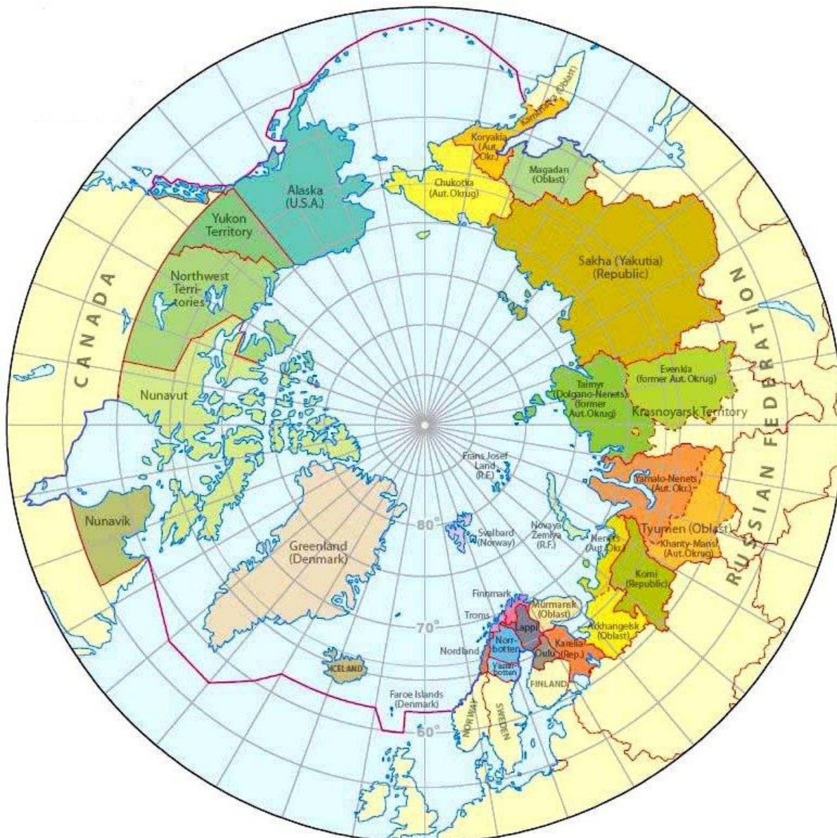
Figur 1. Karta över Arktis administrativa gränser. Människorna i Arktis kallas ibland för cirkumpolära folk, vilket betyder folk som lever runt Nordpolen. Men beroende på hur långt söderut från polen man går, desto fler människor stöter man på. Man måste alltid vara ytterst försiktig när man talar om gränser och om vilka arktiska eller cirkumpolära folk som lever i det ena eller andra området. Därför är det alltid en definitionsfråga vilka som kan och bör – och även vill – räknas som arktiska folk. Tydliga politiska och etnografiska gränslinjer överensstämmer långtifrån alltid med hur ursprungsbefolkningarna själva levt och lever – samt hur de ser på och uppfattar sig själva. 58

Bland de pastorala nomaderna i både avlägsna trakter samt tredje världen – främst i Afrikas och Centralasiens halvtorra områden, finns också de som tillämpar transhumance 59 ,