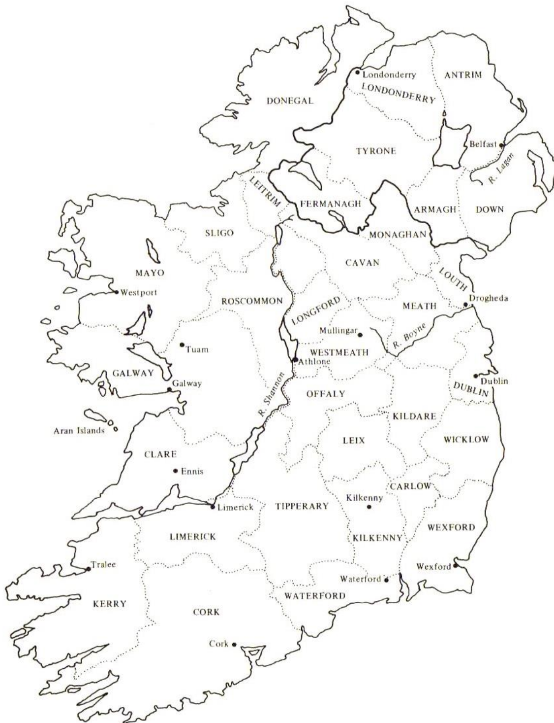
Figur 3. Politisk karta av Irland, med grevskapens angivna gränslinjer. 171