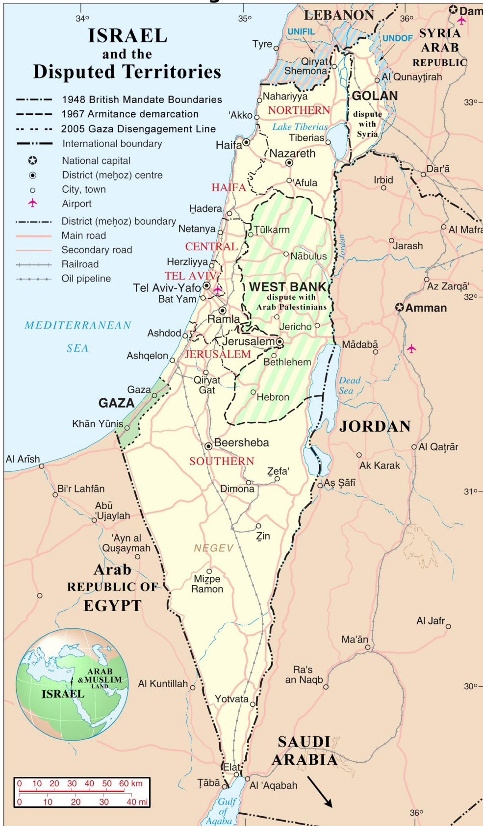
Illustration 1: Karta över Israel och de ockuperade Palestinska områdena.