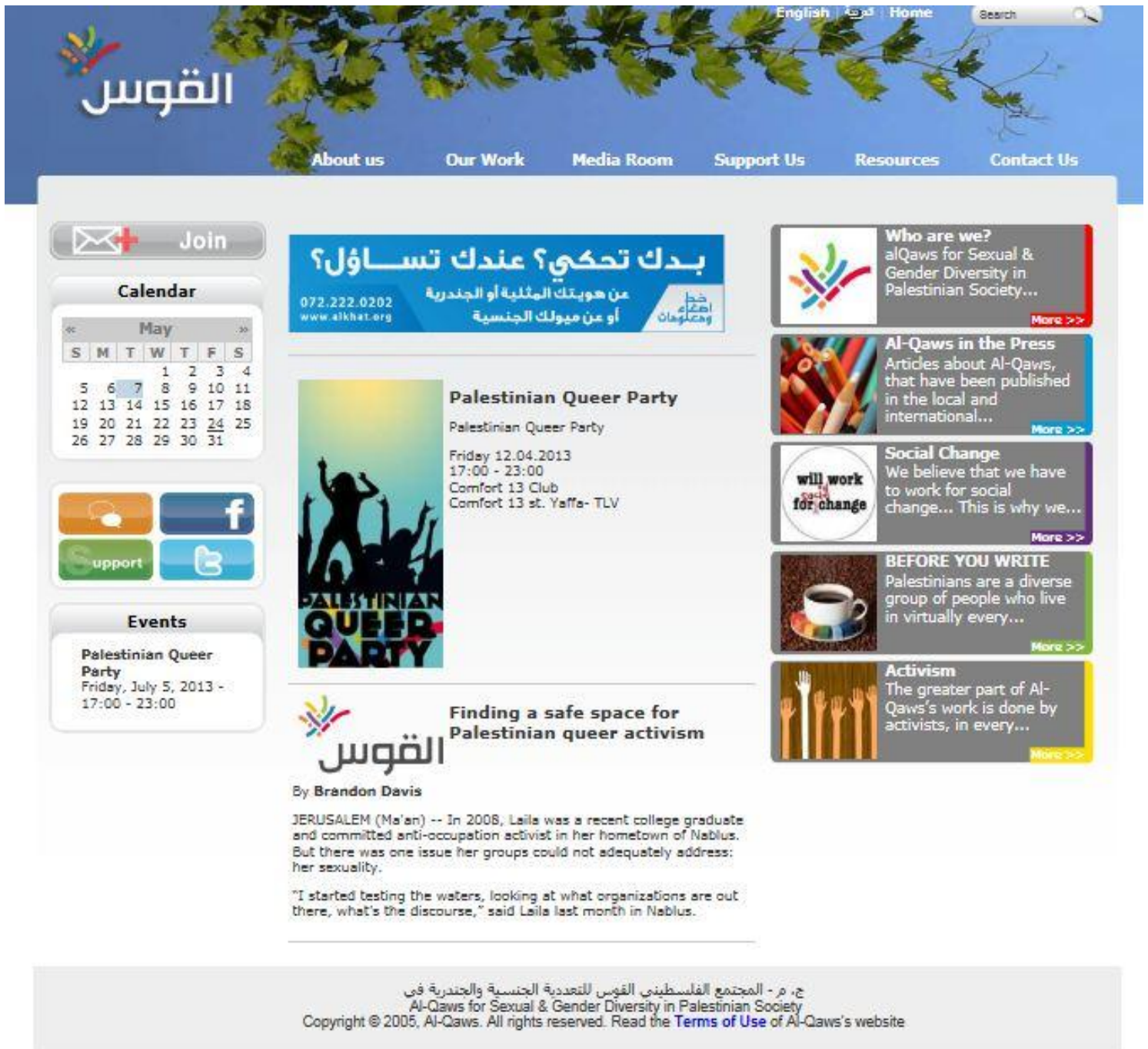
Illustration 3. Al-Qaws förstasida (enligt 2013-05-07)