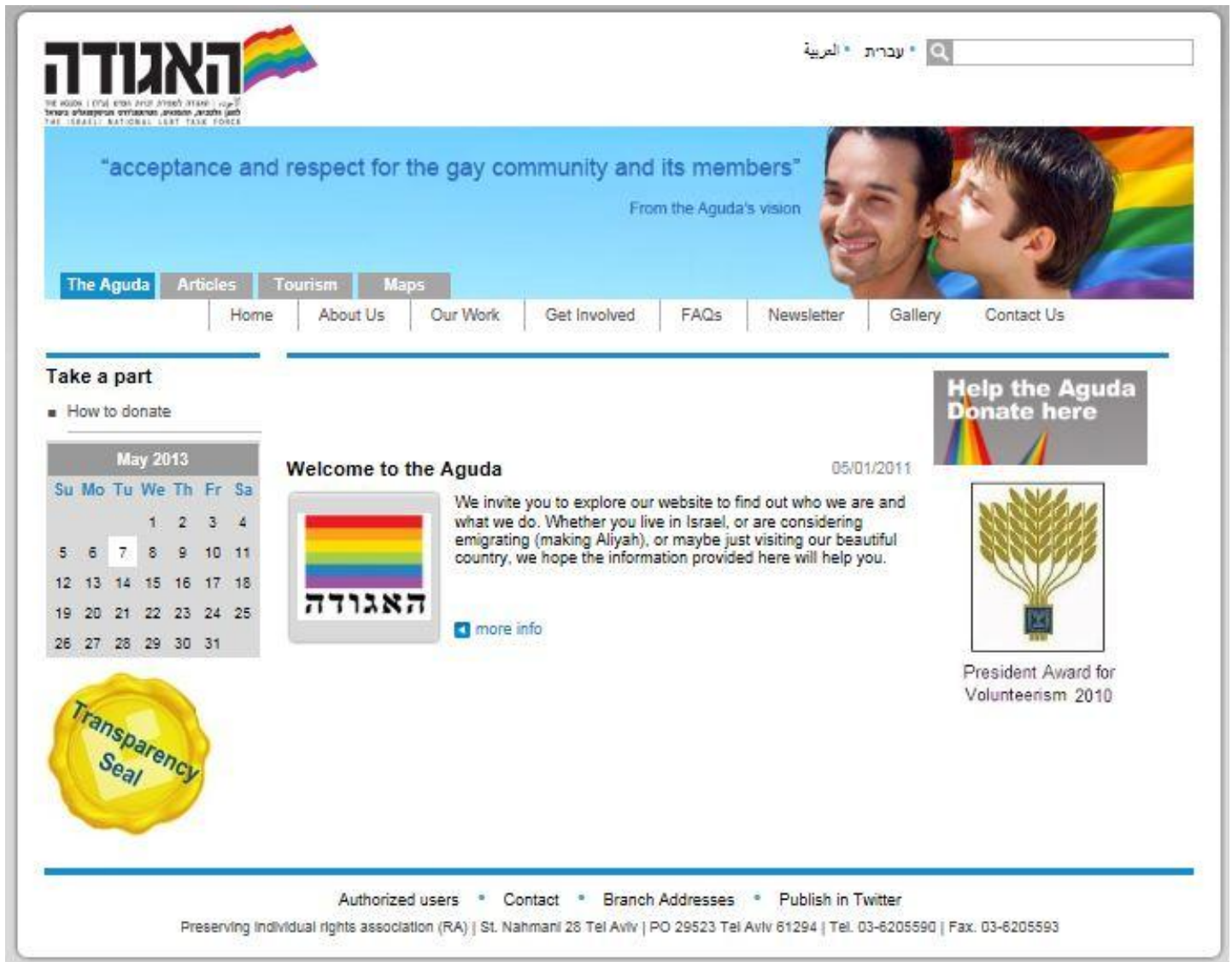
Illustration 1. Agudas förstasida (enligt 2013-05-07)