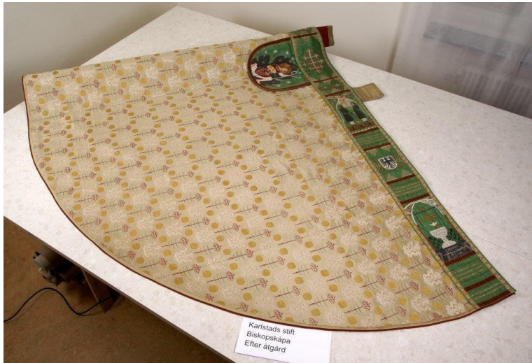
Fig. 2. Biskop Arvid Runestams kåpa efter konservering.