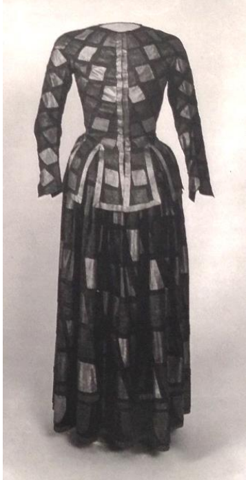
Fig. 3. Arlequindräkt.