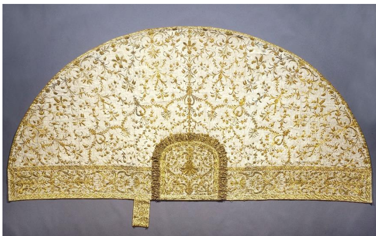
Fig. 1. Ärkebiskopskåpa Tx I nr. 38.