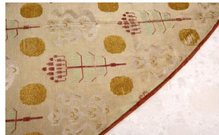
Fotodokumentation efter åtgärd