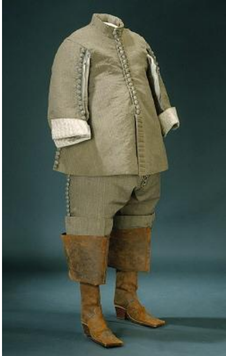
Fig. 4. Karl X Gustavs byxor.