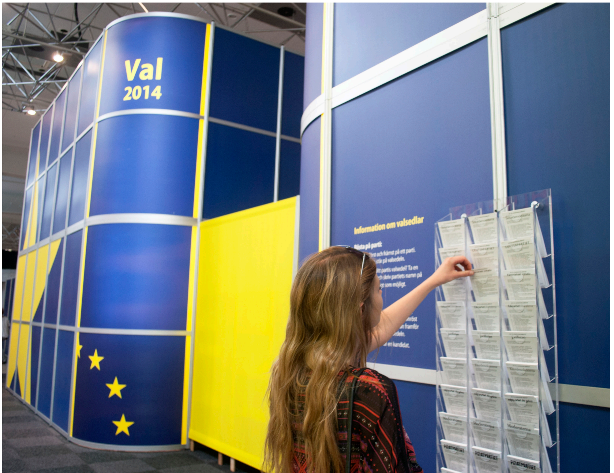
Endast 45,53 procent av det svenska folket röstade i EU-valet 2009.