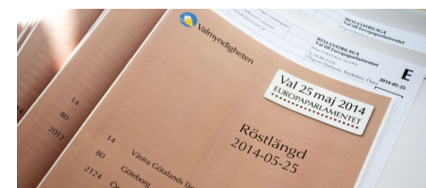
Politikerna röstdeltagande kontrollerades i röstlängder.

Bortfall: Fyra personer var ej röstberättigade, medan fem personer av olika skäl saknades i röstlängderna.