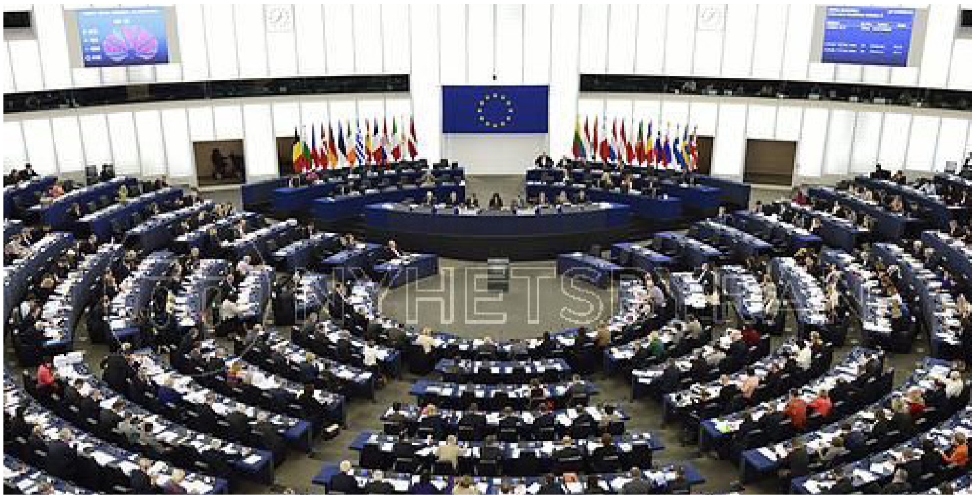
Flest röstskolkare i Dalsland finns i Bengtsfors. Där struntade sex av 34 politiker i att gå och rösta i EU-valet 2009.