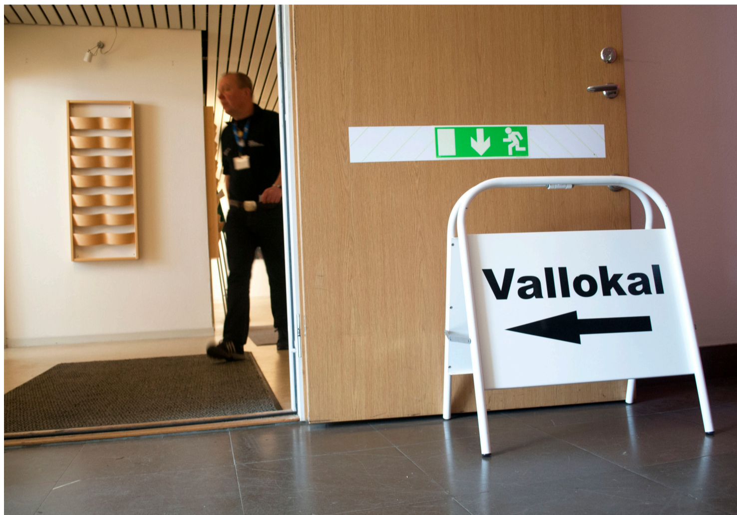
I Vänersborg struntade fyra kommunpolitiker i att gå att rösta i EU-valet 2009. I Trollhättan röstade alla politiker.