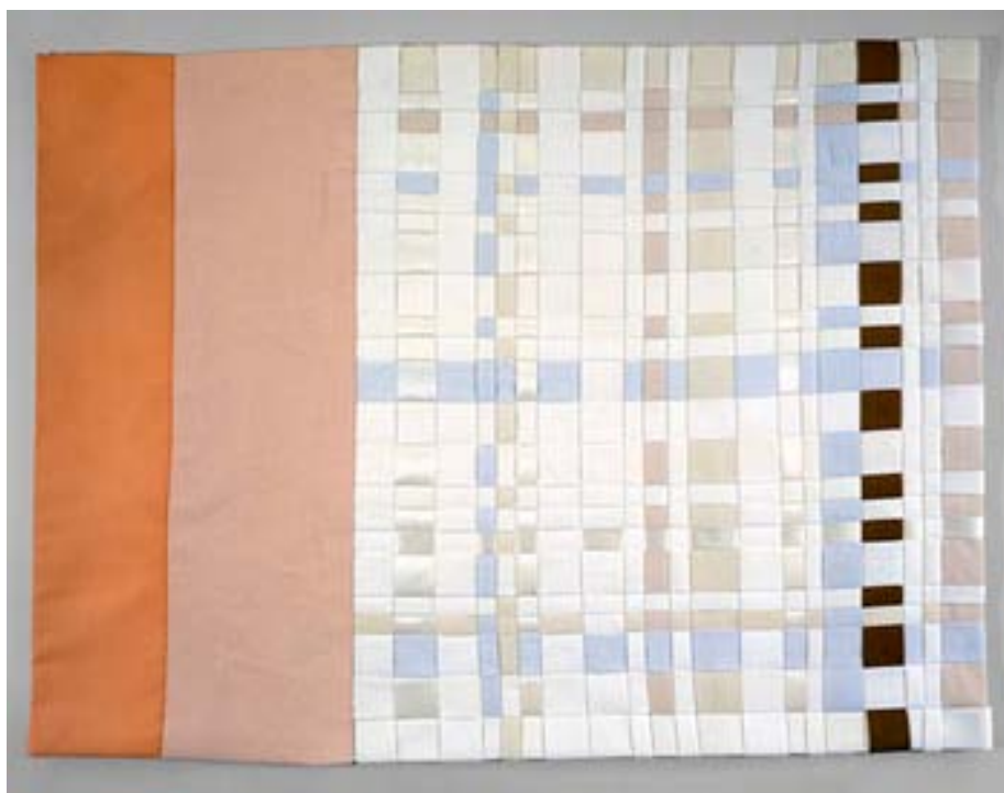
Louise Bourgeois, Utan titel , 2003