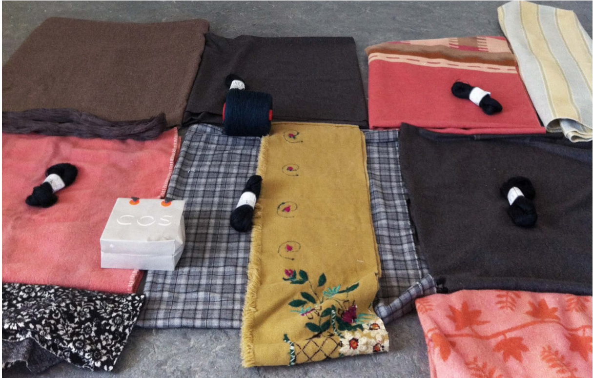
Skiss i materialet i skala 1:1