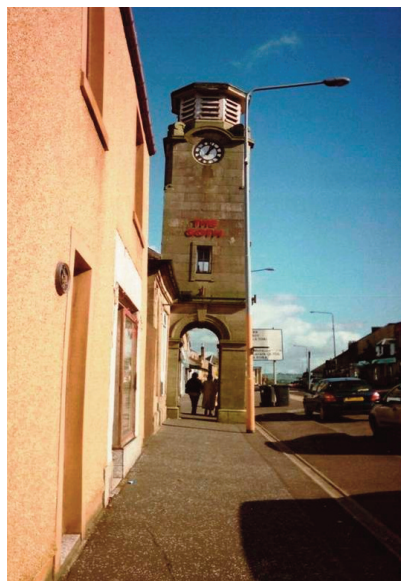
The Goth i Armadale.