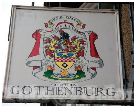
Närbild av den nyrestaurerade skylten på puben The Prestoungrange Gothenburg Prestonpans.

”a Goth” är. Som före detta arkeolog associerade jag naturligtvis till folkslaget goter – men det var fel svar. I Skottland är ”a Goth” eller ”a Gothenburg” namnet på ett slag av pub, som efter modell av det s.k. Göteborgssystemet introducerades i Skottland av en av de återvändande skottarna. Att något så brittiskt som en pub kallas Gothenburg gjorde mig naturligtvis nyfiken.