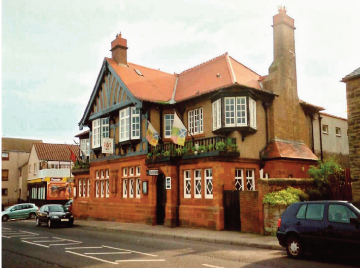
The Prestoungrange Gothenburg vid huvudgatan i Prestonpans. Puben byggdes 1908 och restaurerades 2002-2004.