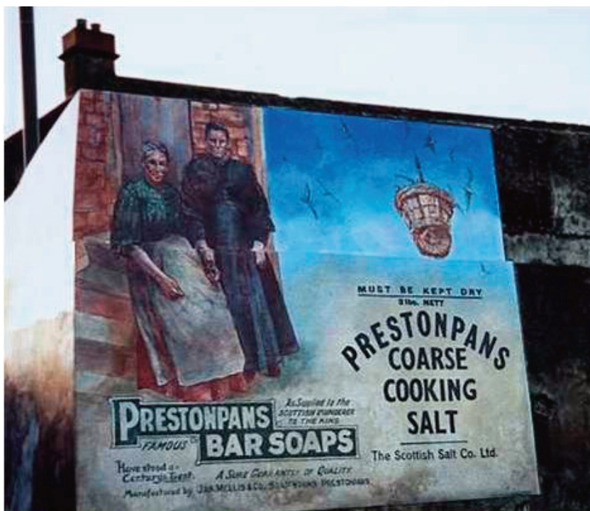
Muralmålningen "Gruvarbetarhustrur och salt" av Kate Hunter påminner om att salttkokningen tidigare var en av de viktigaste industrierna i Prestonpans. Den sysselsatte många kvinnor liksom den tvättillverkning, som saltet bland annat användes till.

Mulhern publicerade sin artikel 2006 fanns det tre kända Goths som fortfarande drevs utifrån de gamla principerna. Det är The Dean Tavern i Newtongrange, The Goth, Armadale och The Gothenburg, Prestonpans. Jag har redan berättat en del om The Gothenburg i Prestonpans och vill nu också säga några ord om de andra två.