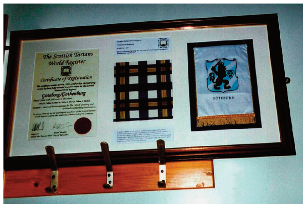
Tavlan på en vägg i styrelserummet i The Goth, Armadale, är en länk till de återupptagna kontakterna med ursprunget i Göteborg.

Samhällsförändringarna under 1900-talet ledde till att de flesta Goths försvann, inte alltid rent fysiskt eftersom byggnaderna kunde användas för andra ändamål, exempelvis privatägda pubar eller hotell. När Mark