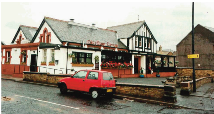
The Dean Tavern i Newtongrange har alltid drivits utifrån göteborgssystemets principer men har aldrig haft namnet Gothenburg.

Vid huvudgatan i Newtongrange ligger The Dean Tavern. Den tillkom 1899 utifrån göteborgssystemets principer men har inte haft namnet Gothenburg. På dess hemsida kan vi ändå läsa, att The Dean Tavern är ”the last ‘Goth’ left in Scotland”. Newtongrange blev enligt hemsidan en spökstad, när gruvan Lady Victoria stängdes 1981. Då fanns det t.o.m. planer på att riva hela samhället. Sedan vände det på 1990-talet, med etableringen av gruvmuseet och byggandet av nya hus, som nu främst bebos av pendlare som arbetar i Edinburgh.