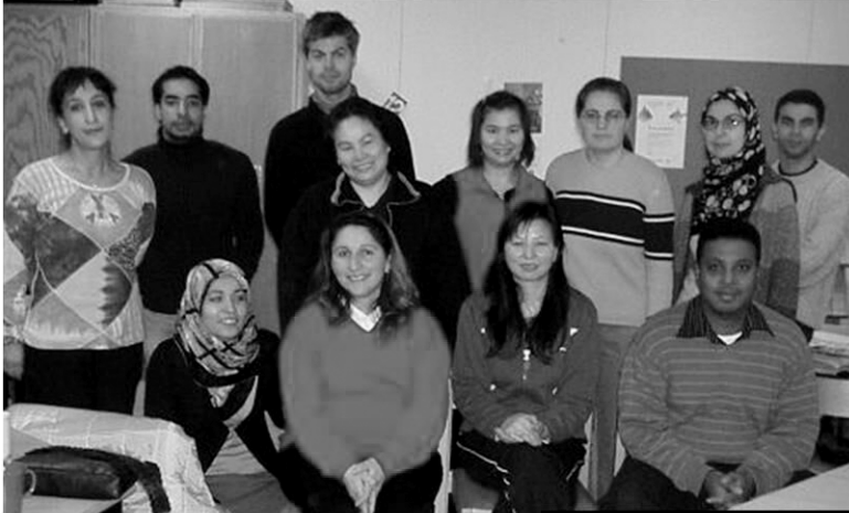
Delar av klass 3 år 2004

bekanta till elever och lärare lättare kan inbjudas till besök i skolan, vilket gör att skolan blir en angelägen mötesplats för kunskapsutbyten för ännu fler människor.