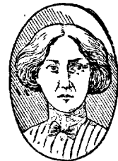
Gammal och grå vid 27 år.