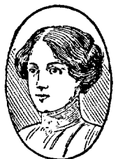
Ung och lycklig vid 85 år.

Denna kvinna vill berätta för Eder, hur hon botade grått hår. Ingen färg eller annan skadlig metod. Resultat på 8 dagar. Preparatet är en oskadlig vätska som återställer naturliga färgen till Eder's hår, oavsett vad Eder's ålder eller orsaken till hårets gråhet är. Det är ingen hårfärg. Kan användas av män och kvinnor i alla åldrar. Intyg av kemist om medlets oskadlighet medföljer. Säljes i Stockholm hos Ch. Sandbergs Missionsbokhandel, Västerlånggatan 66, samt i Uppsala hos Ch. Svenssons parfymhandel, Drottninggatan 4, i Örebro hos Nya Missionsbokhandeln, Storgatan 28, i Göteborg hos »Damfriseringen» Andra Långgatan 82. Till landsorten mot postförskott. Pris 2.50 pr flaska + porto.