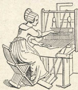
Väfverska i 16:e århundradet.

sider ridande förbi flickans stuga och såg henne genom fönstret sitta och spinna.