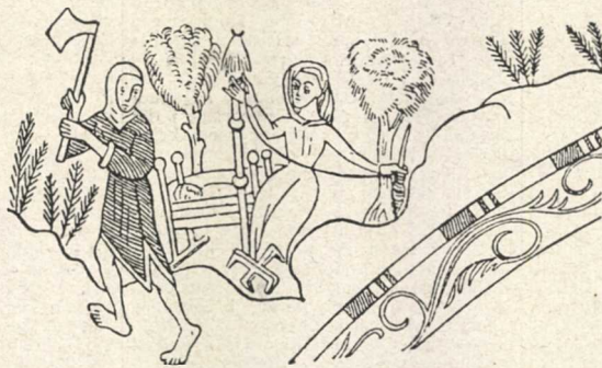
Spinnerska. Dansk kyrklig kalkmålning.

Skulle du emellertid träffa honom och slå dig i språk med honom, så kan du dock vara öfvertygad om, att han råder dig, att hvad du tar dig till i världen, så bli då för all del inte torpare hos en bonde!