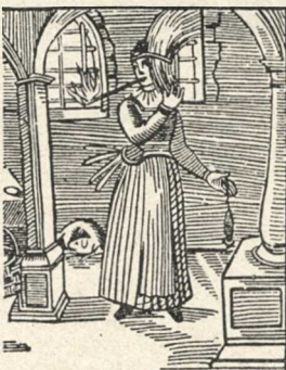
Spinnerska. Olaus Magnus historia 1535.

Mindre bekant är kanske sagan om "Sländan, skytteln och nålen." En fattig flicka ärfde dessa föremål efter sin fostermor. Vid den tiden drog konungens son ut för att söka sig en brud. Fattig skulle hon inte vara och ej heller rik, men på samma gång den fattigaste och den rikaste. Prinsen kom om-