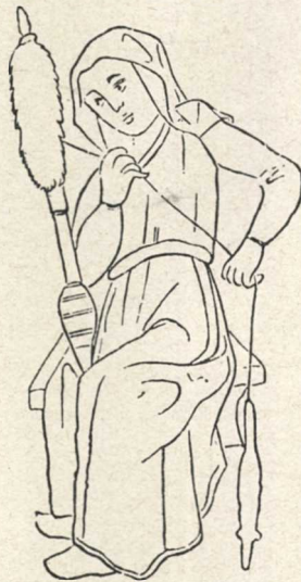
Spinnerska. Svensk kyrklig kalkmålning.

kommit som handelsvara på Fyen. Som industri lär tillverkningen i synnerhet hafva bedrivits i Norge och i Nederländerna, där man då odlade nässlor. Som bekant hafva de praktiska tyskarna nu under krigsåren upptagit nässelodlingen för textila ändamål, och våren 1917 väcktes förslag i Danmark om rationell odling af nässlor i skogarna, närmast för att ersätta den nu svåråtkomliga bomullen. Förslaget resulterade i statsanslag till Polyteknisk Laereanstalt, som under sommaren gjorde omfattande experiment i Rude