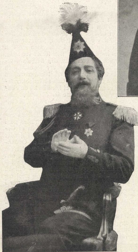
Som kungen i de Flers och Caillavets lustspel med samma namn.