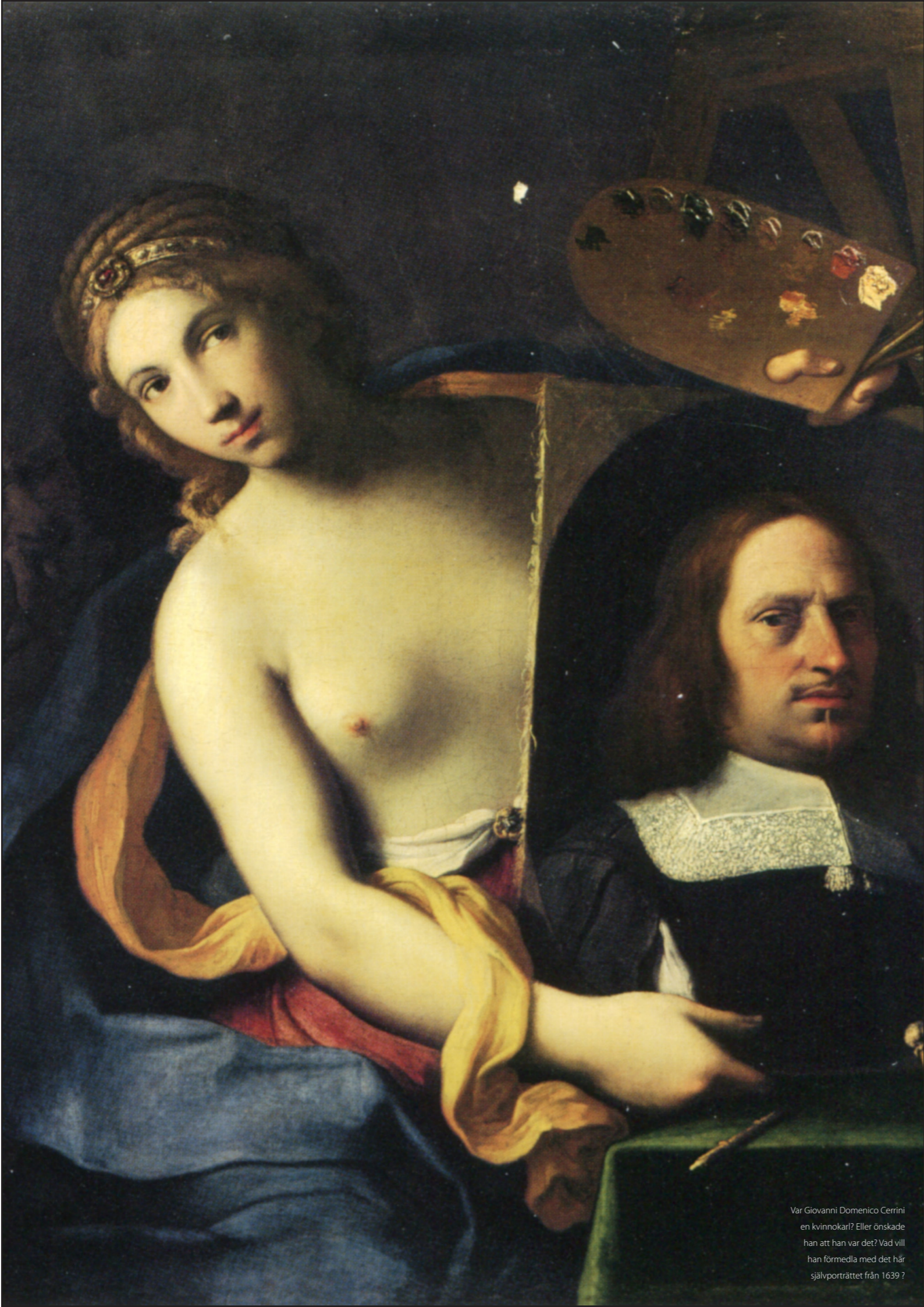
Var Giovanni Domenico Cerrini en kvinnokarl? Eller önskade han att han var det? Vad vill han förmedla med det här självpporträttet från 1639?