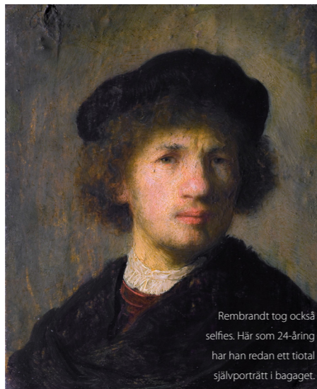
Rembrandt tog också selfies. Här som 24-åring har han redan ett tiotal självporträtt i bagaget.

I VÅR UNDERSÖKNING visar det sig att nästan 75 procent av de selfieaktiva tycker att det är viktigt att se bra ut på bilderna de lägger upp. Vad “bra” innebär är naturligtvis individuellt men man är noggrann med vilken