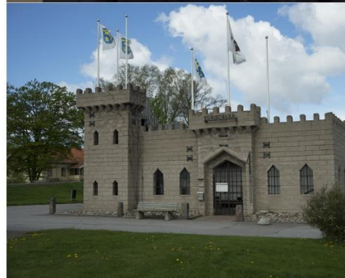
Tröts att Gullspåns kommun mött många motgångar de senaste decennierna med nedlagda bruk och berg (S) (längst ner th) hoppfall inför framtiden.

ske dyker några Gullspångsbor upp för att handla? Fortfarande folktomt, så när som på en äldre man med flakmoped och långt vitt hår.