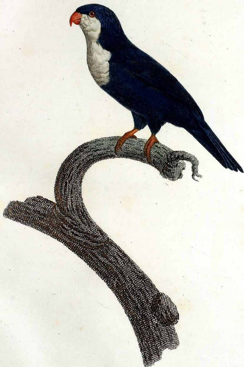
La Perruche Arimanon. Pl. 65.