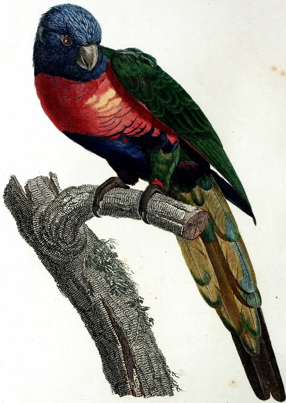
Perruche à tête bleue, mâle. Pl. 24.