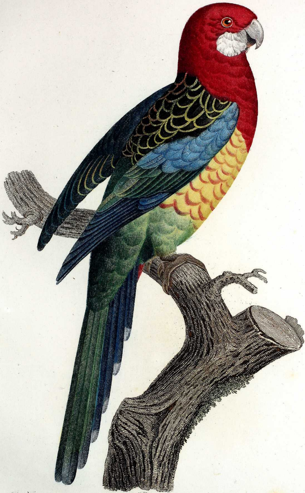
Variété de la Perruche omnicolore. Pl. 29.