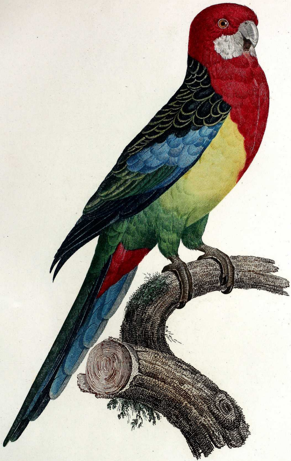
Perruche omnicolore. Pl. 28.