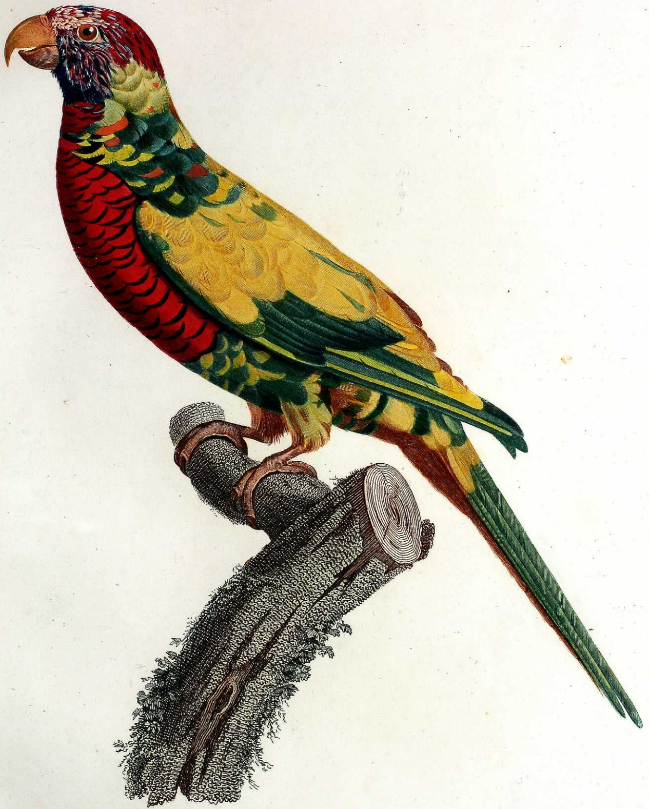
Variété de la Perruche à tête bleue. Pl. 27.