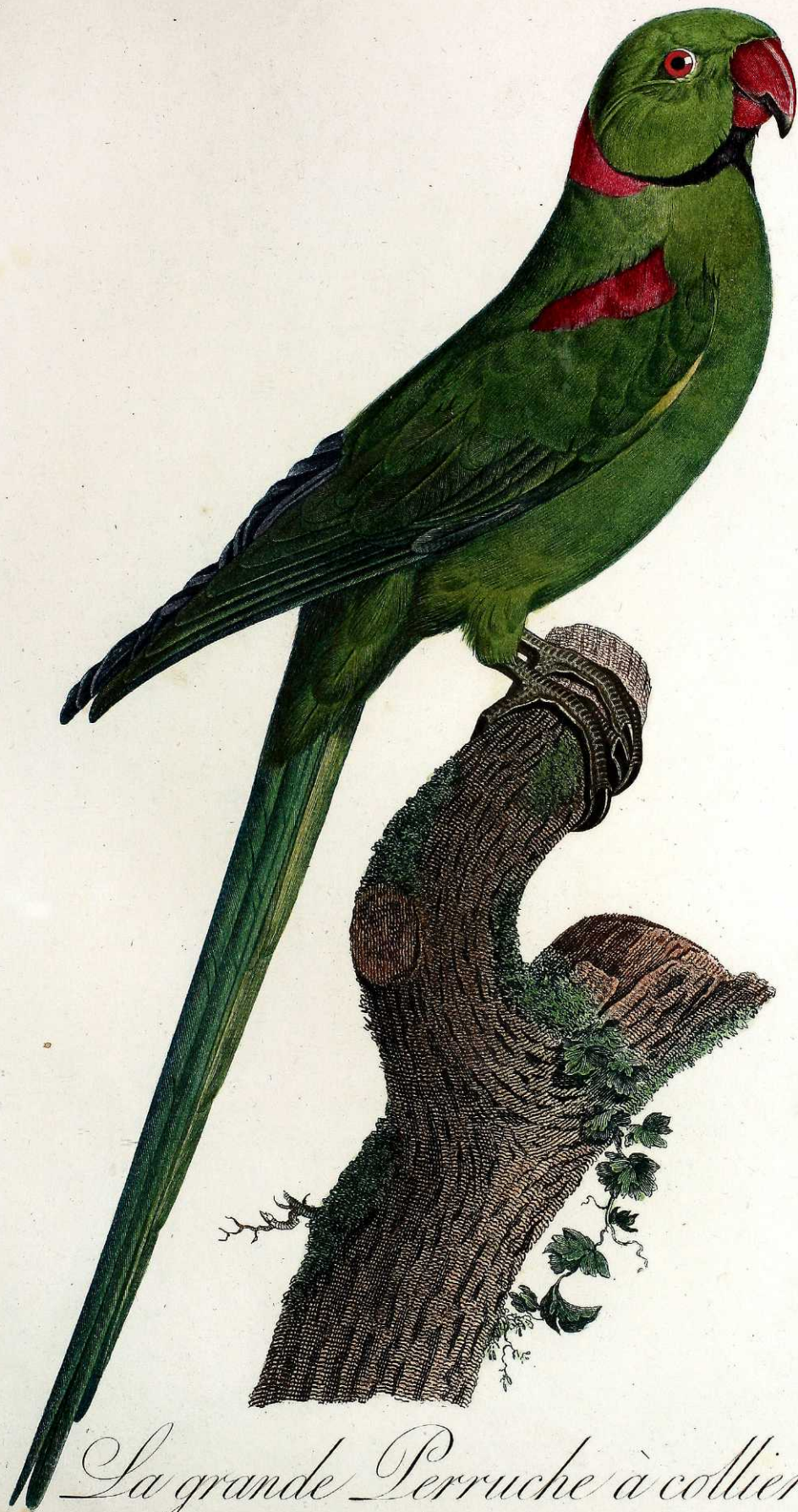
La grande Perruche à collier. Pl. 50.