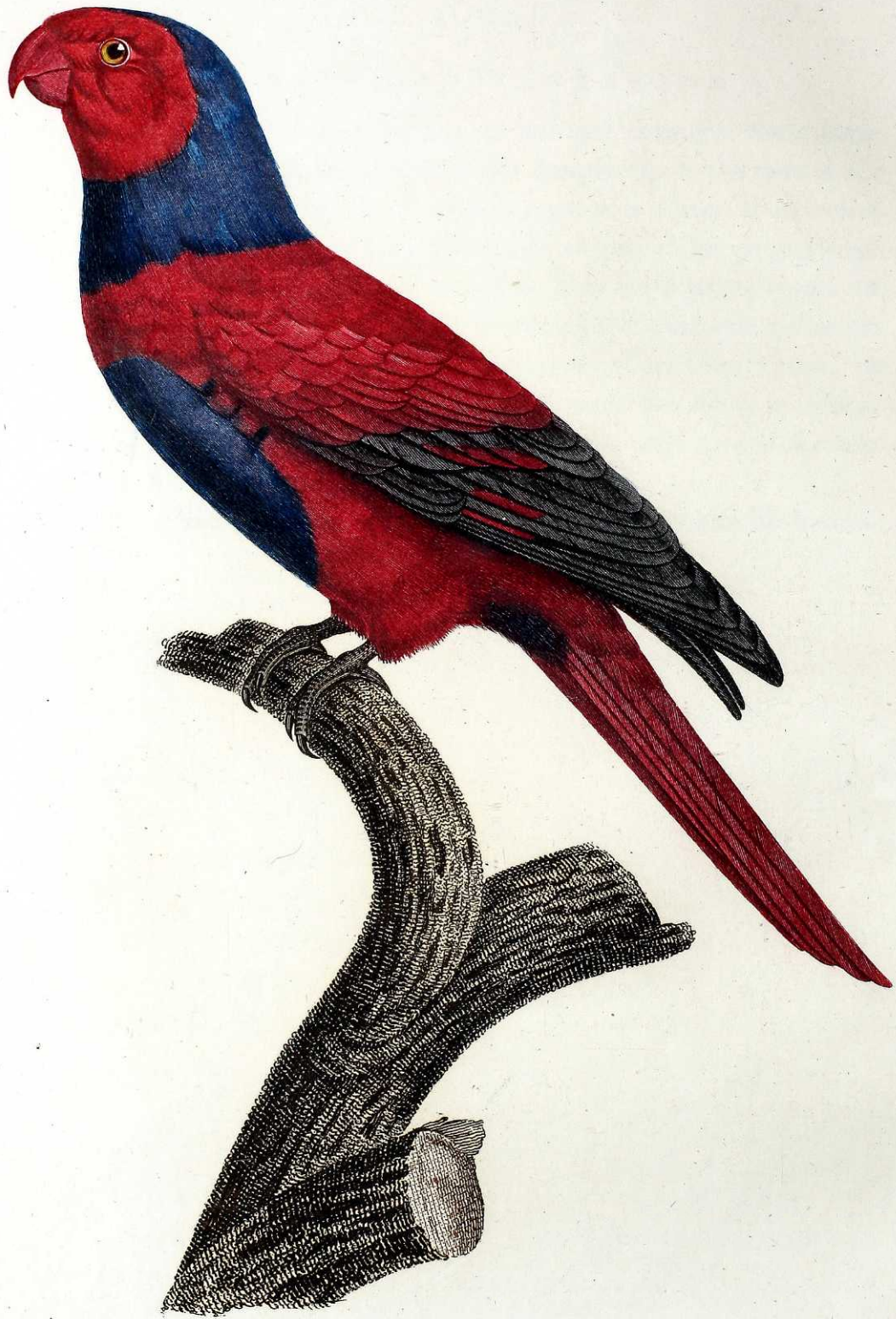
Perruche à Chaperon bleu. Pl. 54.