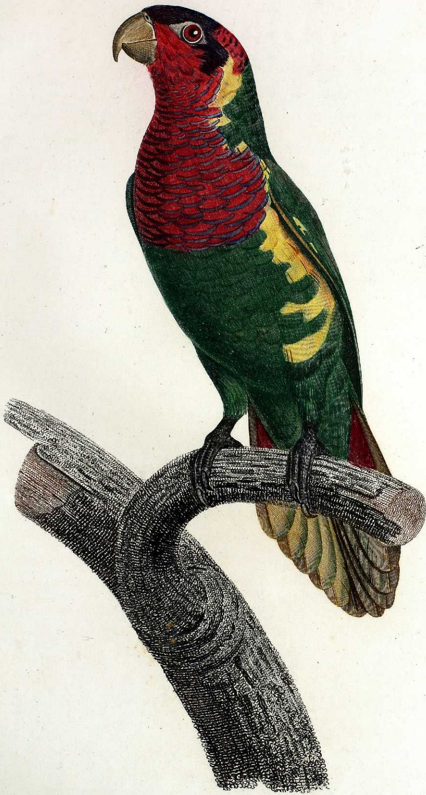
La Perruche Lori. Pl. 52.