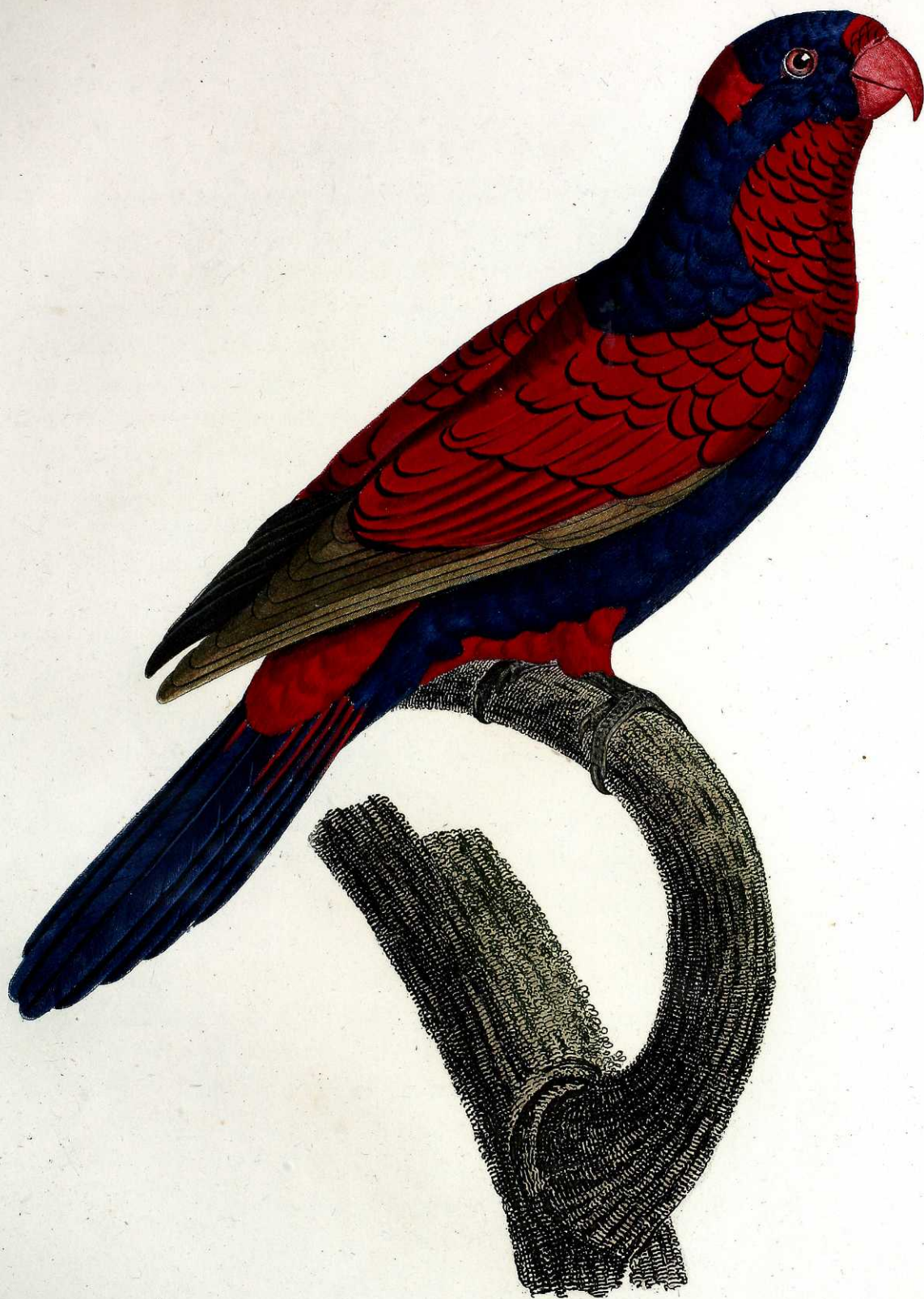
Le Lori Perruche violet et rouge. Pl. 55.