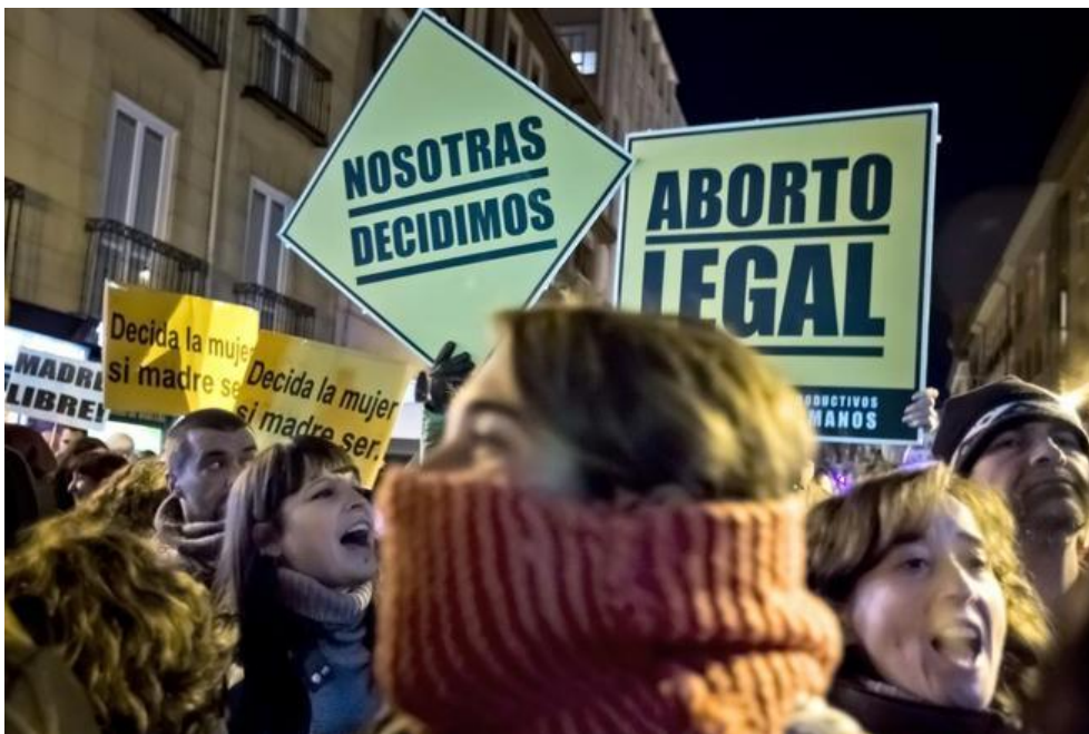
Protesta ante el Ministerio de Justicia este viernes Efe ESTHER MUCIENTES > Madrid