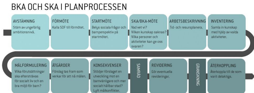
Figur 2 Ett schema över SDNs tilltänkta deltagande och BKA/SKA i planprocessen enligt Stadsbyggnadskontoret

Slutsatsen var att de användes på varierande sätt, både som praktiska verktyg och som mer övergripande tankemodeller. Författaren menade att det fanns behov av att skapa tydligare rutiner men den stora behållningen ansågs vara att verktygen erbjöd "ett gemensamt språk" för samtal och samverkan kring den sociala dimensionen. Ett av de stora hindren för arbete med konsekvensanalyser uppgavs av planhandläggare vara tidsbrist. Handläggare menade att tid saknades för att fördjupa sig i konsekvensanalyser, vilket i samband med de många andra juridiska och politiska krav som finns på planprocessen (Göteborg 2011b).