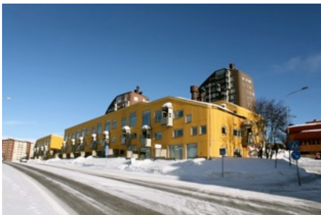
Fig. 8 Kvarteret Ortdrivaren av Ralph Erskine mars 2015