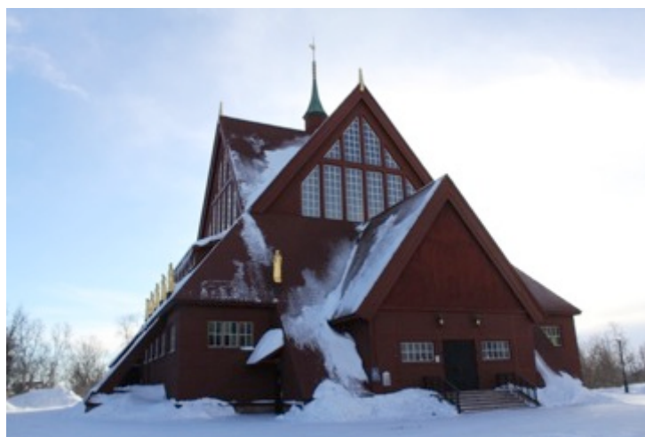
Fig. 7 Kiruna kyrka, foto: eget, mars 2015

I Norrland på spåret omskrivs kyrkans tillblivelse, och inspirationen sägs ha hämtats från samekåtor, svenska klockstaplar och norska stavkyrkor. Det är