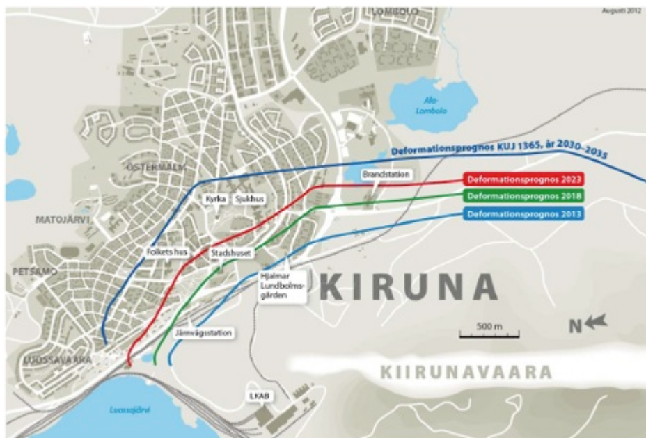
Fig.1 Deformationsutbredning, fördjupad översiktsplan Kiruna kommun 2014

att flyttas, och placeras i anslutning till ny bebyggelse. 45 Placering och integrering av dessa kulturhistoriskt värdefulla byggnader utarbetas i samråd med kommunantikvarien i Kiruna. 46