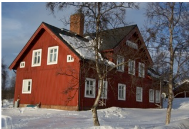
Fig.6 Arbetarbostad SJ-området, foto: eget, mars 2015

Brunnström skriver i det inledande kapitlet till sin avhandling att bebyggelsen dess tillkomst är mycket svårfångad gällande SJ:s byggnader. SJ-arkivets stora omfattning sägs också vara en bidragande anledning till att SJ-området inte behandlas så ingående i avhandlingen. Däremot menar Brunnström att han ändå lyckats fånga de största och viktigaste dragen i bakgrundshistorien hos vissa av byggnaderna på SJ-området. 126 Folke Zetterwalls betydelse för SJ-