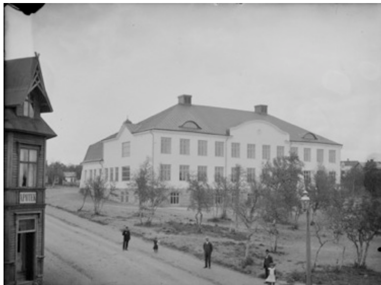
Fig.5 Centrumskolan, år okänt

Brunnström menar att gruvbolaget hade ett stort intresse av att skapa ett välordnat och prydligt samhälle när Kiruna skulle grundas. De skolor som bolaget byggde, uppfördes på centrala platser och andra välfärdsinrättningar såsom sjukstuga, post, brandstation och telegrafstation anlades i nära anslutning till stadsplanen för att