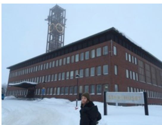
Fig. 9 Stadshuset, foto: eget mars 2015