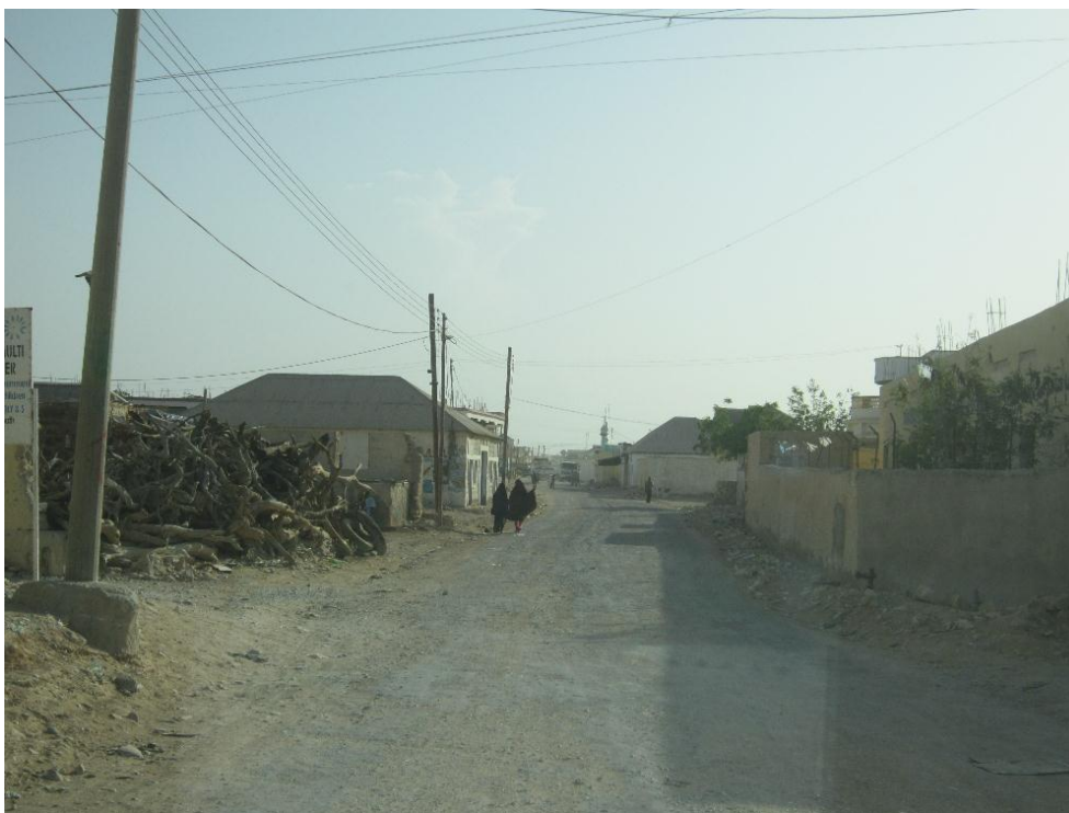
Gatuvy från Boosaaso, Somalia, juni 2012.

Rapport från utredningsresa till Nairobi, Kenya och Mogadishu, Hargeisa och Boosaaso i Somalia i juni 2012.