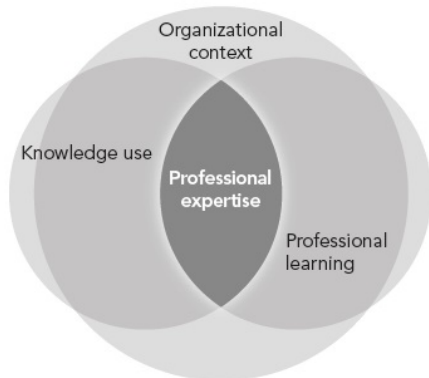
Figure 2. An emergent model of evidence-based practice as processes of knowledge use and learning

Avby verkar också mena, i likhet med EBP-modellen i överenskommelserna, att när lärandet fokuseras så innebär det att EBP växer till någonting som en organisation gör, inte något som en individ gör.