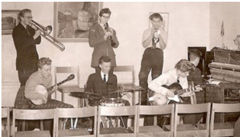
Skolbandsjazz: Magnolia Jazzband (1953-1957), ett av Göteborgs ”bästa” skolband som spelar dixieland på Källtorps ungdomsgård 1955.