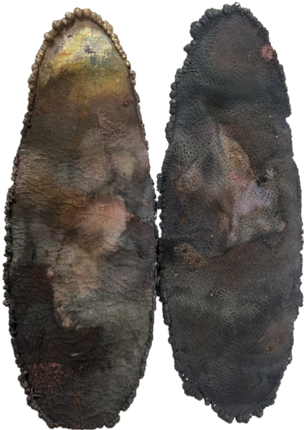
Halvband på gäng med fina väder.