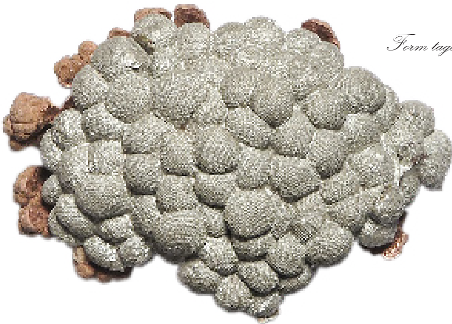
Form tagen från textillblöbar.

Efter jag bestämt mig för att utgå från den ovala formen och uttrycket från sepian lyckas jag få till ett spännande flöde i arbetet. Olika storlekar och utgångsmaterial skapar nya ytor. Insidorna av en mangokärna kan se ut som tjock hud med ytliga ådror, smidda ytor på sepiaplåten som Psoriasis. Leker med strömstyrkan för ludet matt uttryck eller perfekta avtryck. Nya idéer. Nya förväntningar.