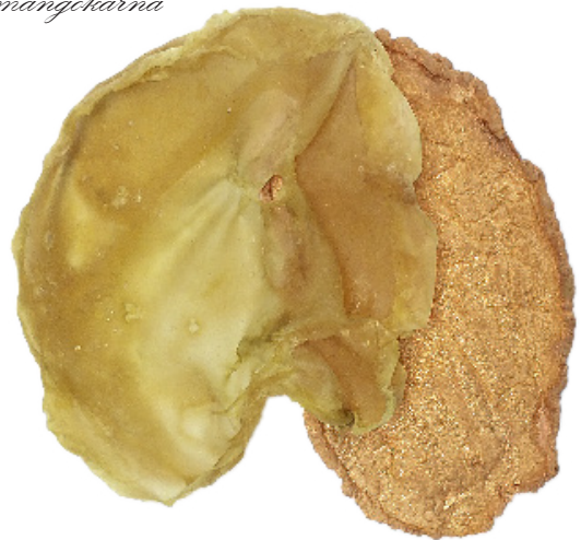
Latex och elektroformad mangokärna