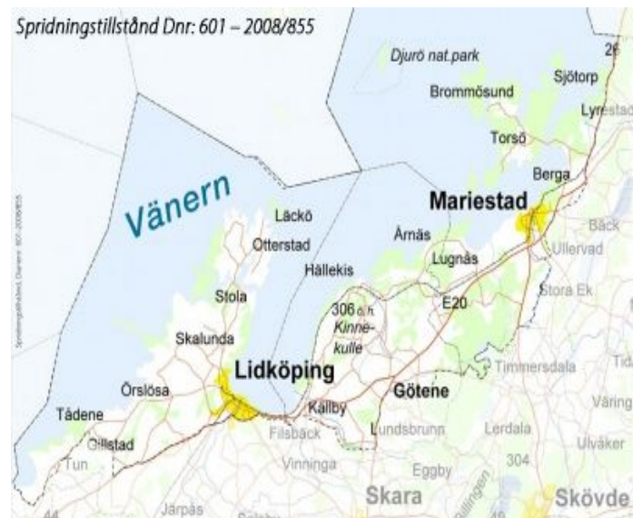
Figur 3: Biosfären, “Vänerskärgråden med Kinnekulle”

Det biosfärområdet jag valt att studera är “Vänerskärgråden med kinnekulle” som blev officiellt utnämnt som biosfärområde av Unesco 2010. 94 “Vänerskärgråden med kinnekulle” har höga landskapsvärden ur både ekologiskt, biologiskt, och kulturhistoriskt perspektiv. Det finns inom området en nationalpark och några större naturreservat samt en mängd rödlistade och hotade arter, men även ekonomiskt betydelsefulla arter och grödor. 95 Kortfattat är biosfärområdets syfte “att uppnå ett långsiktigt hållbart brukande av biosfärens resurser och att förbättra relationen mellan människor och natur, från lokal till global nivå”. 96 Biosfärkontoret har satt upp några punkter på hur detta ska uppnås: genom att främja en hållbar utveckling på lokala villkor, bidra till att bevara landskap, ekosystem och arter, underlätta forskning, demonstrationsprojekt, utbildning och praktik och utveckla internationella och nationella samarbeten. 97 Biosfärkontoret har för avsikt att gynna samhället genom: att skapa tillgång till ett varumärke som är positivt och starkt, stärka det regionala och lokala samarbetet, ge nya möjligheter till lantbruk, skogsbruk, ekoturism och andra näringar som uppfyller biosfärområdets kriterier då myndighet, kommun, företag eller organisation prioriterar praktiska och ekonomiska överenskommelser till biosfärområden, och att enklare uppnå balansen mellan bevarande och utveckling genom att man arbetar tillsammans i detta område. 98