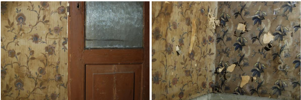
Figur 21 och 22. Vindskammaren

Vindskammaren som är det mest intakta rummet i huset flyttas och bör om möjligt bevaras i sin helhet utan att först monteras isär. Tapeterna kan sedan restaureras och det vävspända taket lagas m.m.