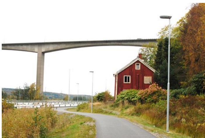
Figur 1. Gästgiveriet Gårdsten sett ifrån söder

Gästgiveriet Gårdsten är en liggtimrad byggnad från början av 1800-talet. Huset ligger i Agnesberg en dryg mil norr om Göteborg och är placerat mellan väg E45 och Gårdstensberget, nästan under Angeredsbron. Byggnaden har troligen använts som gästgiveri i början av 1800-talet och i början av 1900-talet inreddes det med fem lägenheter. Den tros också ha gett namn åt stadsdelen Gårdsten då den byggdes i början på 1970-talet. Under senaste åren har byggnaden stått obebyggd då man under en längre tid försökt hitta en användning för byggnaden på dess nuvarande plats utan att lyckas. Fastighetskontoret som äger byggnaden vill lämna den ifrån sig och Gårdstensbostäder har visat intresse för att ta sig an den. Fastighetskontoret har nu lovat att investera den summa som en rivning skulle ha kostat i en flyttning av byggnaden. Den nya placeringen är tänkt att bli i grönområdet Dalen som ligger mitt i det trafikseparerade miljonprogramområdet Gårdsten. Tanken är att byggnaden på sin nya plats ska användas som föreningslokal. Restaureringen av byggnaden är också tänkt att fungera som en del i en arbetsmarknadsåtgärd i form av en hantverksutbildning för långtidsarbetslösa ungdomar i Gårdsten. Förhoppningen är att man i denna process ska kunna samarbeta med olika etablerade institutioner som sysslar med restaurering, historiskt hantverk och kulturvård. (informant 3)