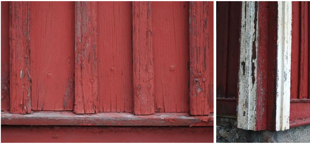
Figur 7. Profilerad lockläkt, vattbräda och smidda spik på fasad 2 och figur 8. Delad knutlåda i hörnet mellan fasad 2 och 3.

Äldre entrédörrar på sida 4 som i nuläget endast skymtas kan restaureras och/eller användas som förlagor till nya ytterdörrar.