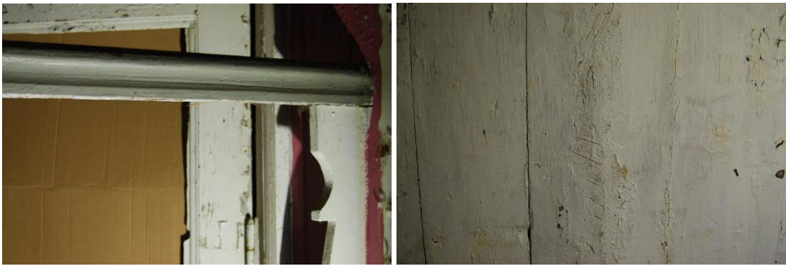
Figur 13. Trappräckets profil på övervåningen och figur 14. Handhyvlade takbrädor

Väggbeklädnaden med lerklining på vassmattor kan nyuppföras på alla timmerväggar enligt befintligt utförande. Även dess måleri med limfärg i olika kulörer kan återskapas.