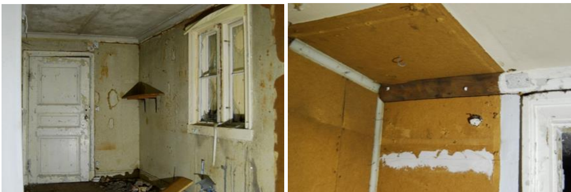
Figur 11. Trefyllningsdörr och englasfönster med innanfönster och figur 12. Bit av äldre taklist.

Trefyllningsdörren mellan rum 5 och 6 på b.v. liksom fyrfyllningsdörren mellan rum 1 och 2 på b.v. bör bevaras och kan fungera som förlagor då nya innerdörrar tillverkas. Även englasfönstren med separata innanfönster i rum 6 på b.v., bör bevaras och användas som förlagor. Detta gäller även taket i rum 10 på b.v., en bit äldre taklist i rum 4 på ö.v. samt trappräckets kortsida i samma rum.