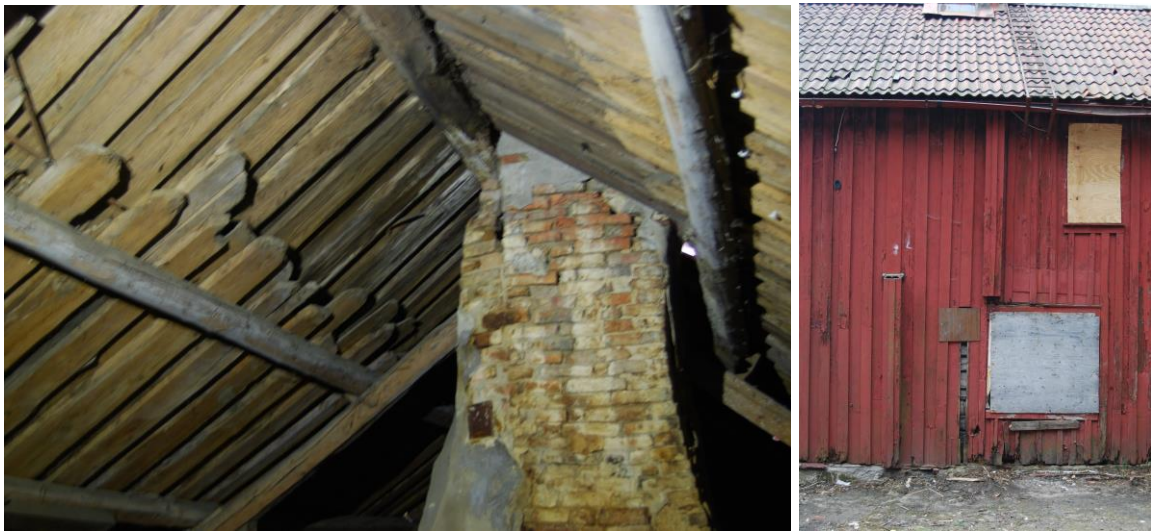
Figur 3. Åstaket sett ifrån vinden och figur 4. Delad utknut på fasad 4

Stengrunden och stentrappan bör flyttas och återanvändas om det är möjligt. Cementbaserad puts bör då samtidigt avlägsnas. Om en flytt inte är möjlig nyuppförs grund och trappa med natursten.