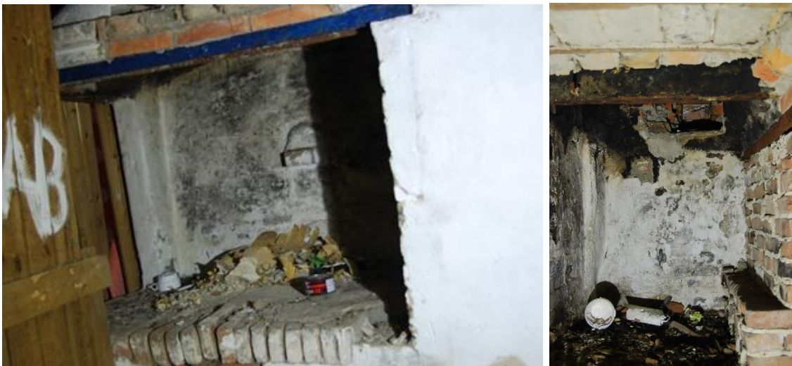
Figur 17 och 18. Den murade öppna spisen

Den öppna spisen och murstockarna är svåra att flytta och bör därför istället återuppföras enligt samma modell, konstruktion och material, d.v.s. med tegel och lerbruk. Detta kräver dock att en mer detaljerad dokumentation först utförs av spiskomplexet.