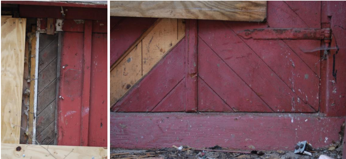
Figur 9 och 10 Delvis övertäckta dörrar på fasad 4

Äldre entrédörrar på sida 4 som i nuläget endast skymtas kan restaureras och/eller användas som förlagor till nya ytterdörrar.