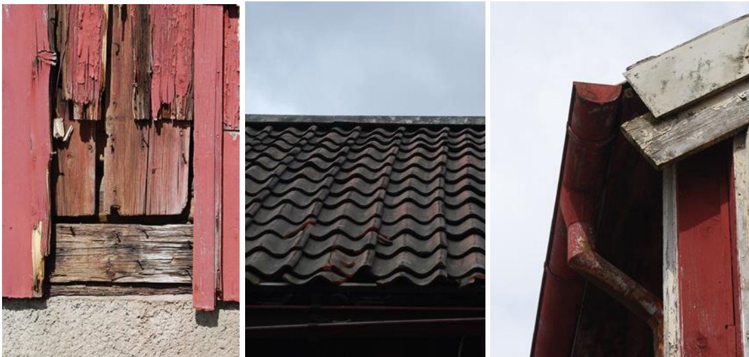
Figur 26. Slamfärgsmålade äldre paneler skymtar fram på fasad 1, figur 27. Det tvåkupiga tegeltaket och figur 28. Stuprör med skarp vinkel på fasad 2.

Den exteriöra färgsättningen från tidigt 1900-tal bevaras fast med röd slamfärg på panelerna och vit linoljefärg på detaljer så som knutlådor, fönster och vindskivor. Även det tvåkupiga tegeltaket från tidigt 1900-tal bör bevaras. Hänggrännor och stuprör kan återuppföras enligt tidigt 1900-talsutformning, d.v.s. i plåt och med skarpa vinklar och målade med linoljefärg i underlagets kulör.