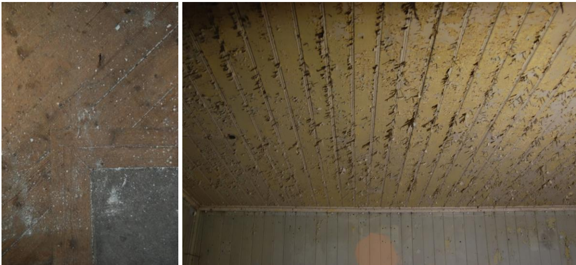
Figur 29. Trägolv med fris i rum 6 på b.v. och figur 30. Pärlspont i tak och på väggar i rum 9 på b.v.

Vissa trägolv och pärlspontstak och/eller -paneler kan vid behov tas tillvara.