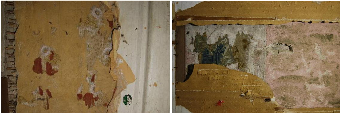
Figur 15 och 16. Lerklinade och målade väggar skymtar fram bakom tapeterna.

Väggbeklädnaden med lerklining på vassmattor kan nyuppföras på alla timmerväggar enligt befintligt utförande. Även dess måleri med limfärg i olika kulörer kan återskapas.