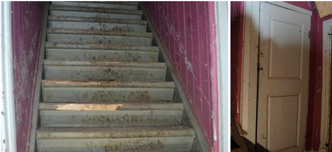
Figur 19. Den invändiga trappan till övervåningen och figur 20. Dörren till skrubben intill trappan

Den invändiga trappan till övervåningen bör bevaras liksom dörren till skrubben intill den.