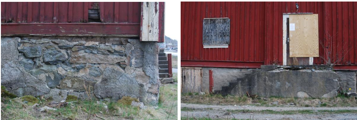
Figur 5. Grunden av natursten på fasad 4 och figur 6. Trappan mot fasad 2.

Stengrunden och stentrappan bör flyttas och återanvändas om det är möjligt. Cementbaserad puts bör då samtidigt avlägsnas. Om en flytt inte är möjlig nyuppförs grund och trappa med natursten.