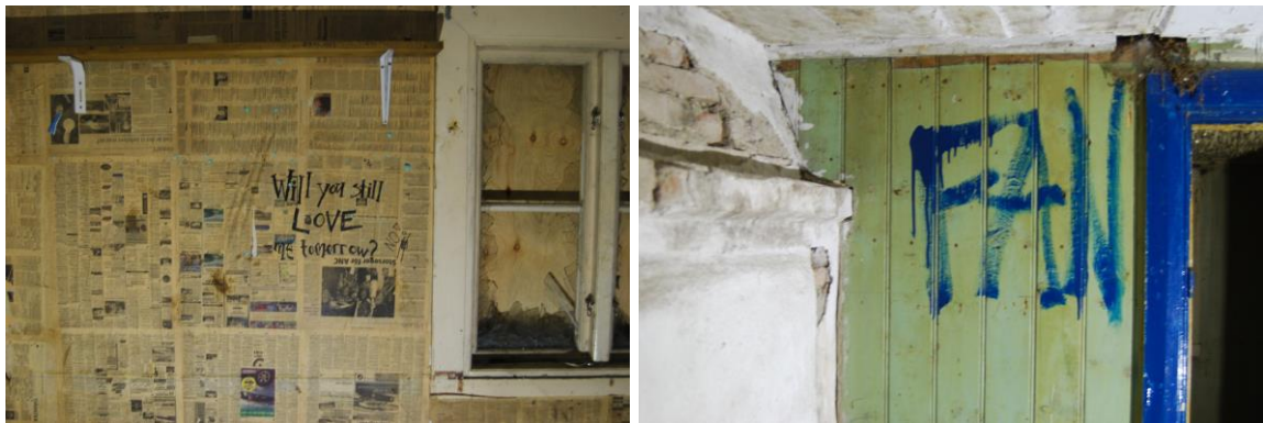
Figur 31. Väggar klädda med tidningspapper i rum 4 på b.v. och figur 32. Klotter på pärlspont i rum 10 på b.v.

Spår ifrån 2000-talet som eventuellt kan bevaras är ytor med klotter/ målningar eller tidningspapper på väggarna som kan tas ned och återuppföras efter flyttningen.