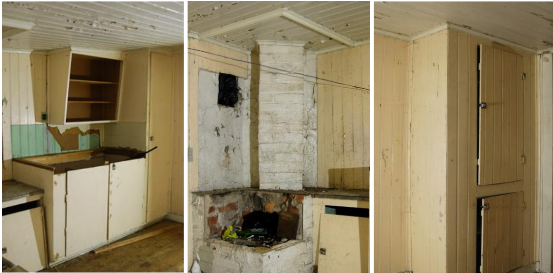
Figur 23-25. Köket i rum 1 på övervåningen