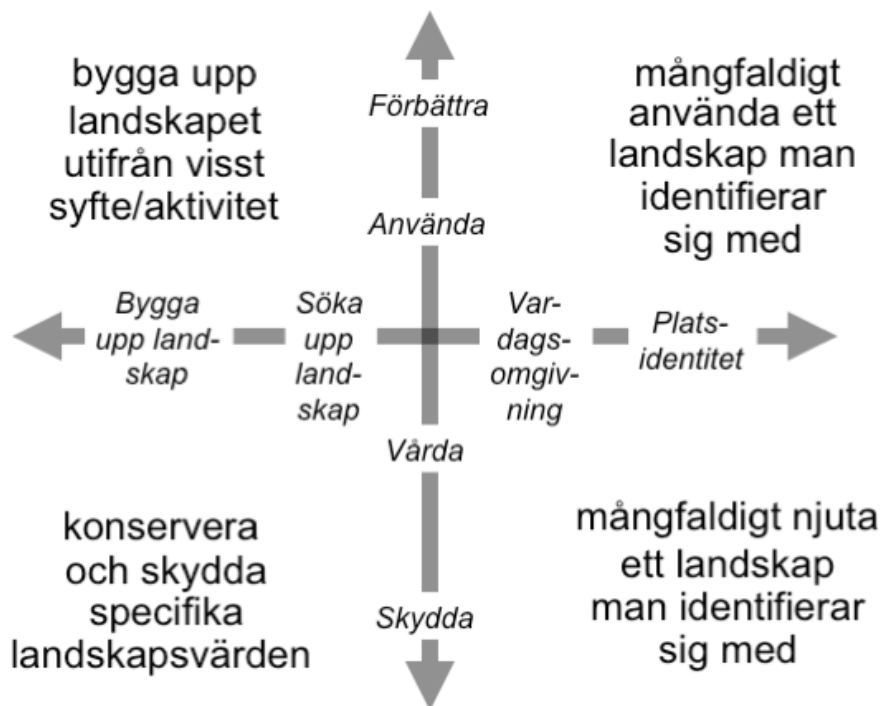
Figur 2: Den ekostrategiska begreppsramen. Källa: Sandell, 2016, s.15. Naturturism och friluftsliv i fjällen – landskapsrelationer i förändring? ETOUR Rapport.

De två grundläggande valen som är utgångspunkt för den ekostrategiska begreppsramen i figuren är dels, på den vågräta axeln, som kan sägas röra sig mellan funktionsspecialisering (till vänster) och territoriellt mångbruk (till höger) medan den lodräta axeln rör sig mellan att aktivt nyttja och förändra landskapet (uppåt) och att vilja bevara och skydda landskapet (nedåt) (Sandell, 2016, s.13-14).