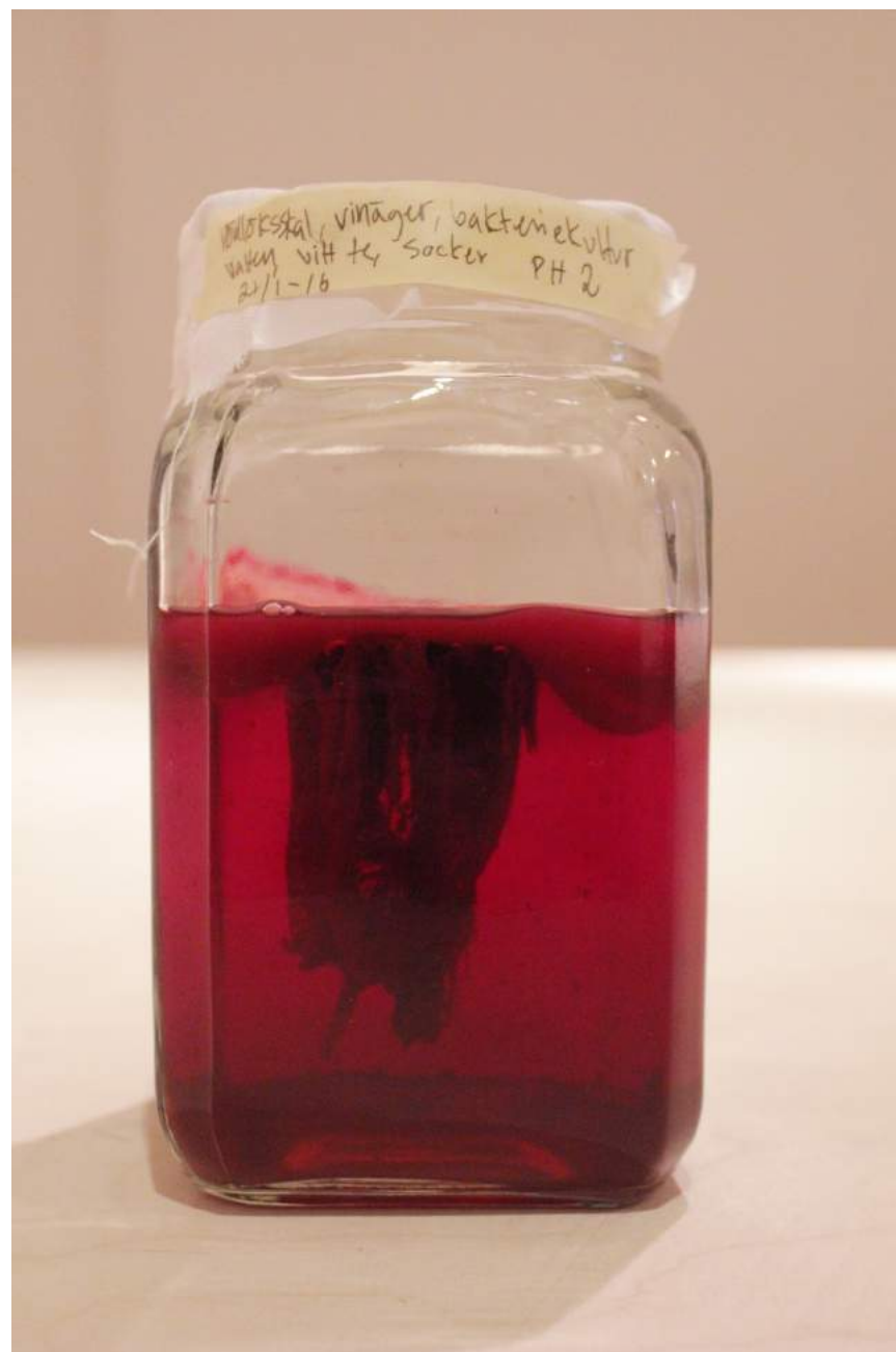
Bilder på två av mina kombucha-odlingar.