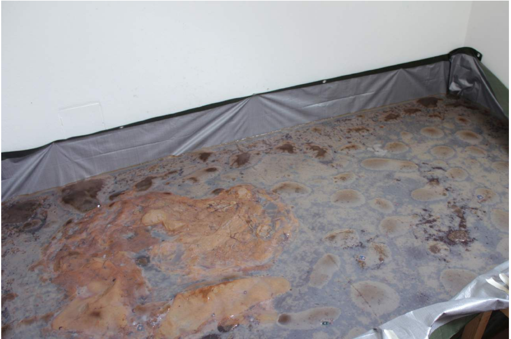
Andra badet, 5 dagar senare.