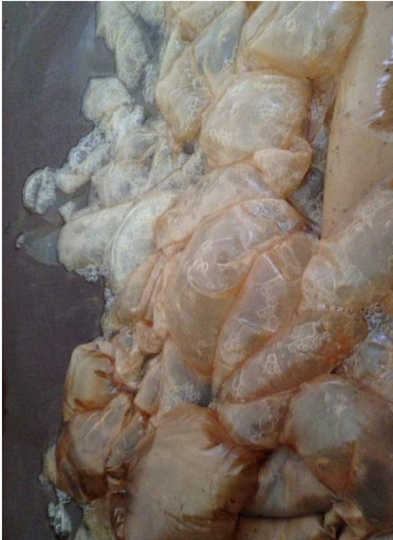
Luftbubblorna som uppstod i badet.