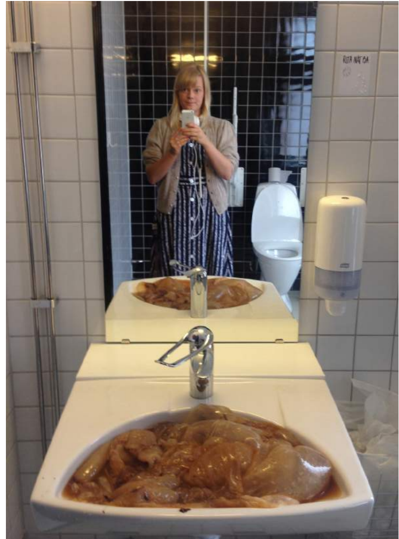
Bubblar upp från handfatet, som att det är på väg att ta över.