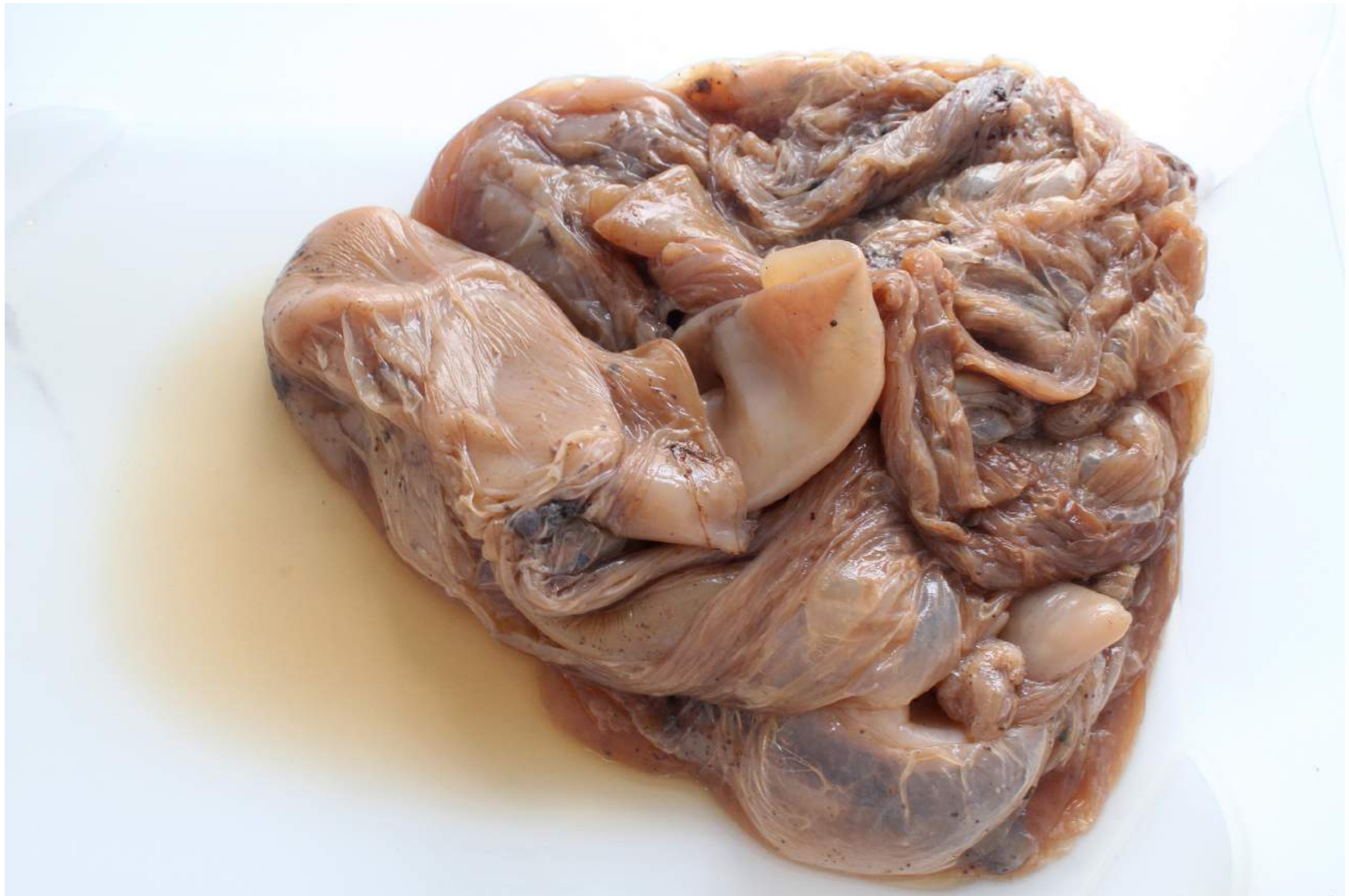
Blöt, köttig klump. Allt vatten som lagt sig i fickorna är nästan borta i biofilmen.