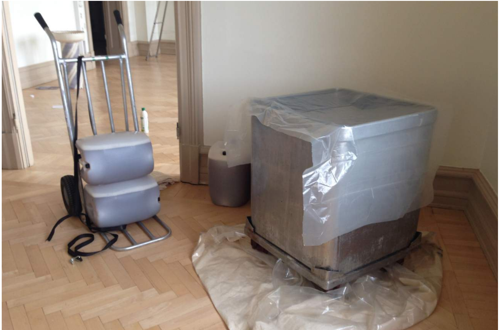
Montering av performancet i utställningsrummet på vasagatan 33.