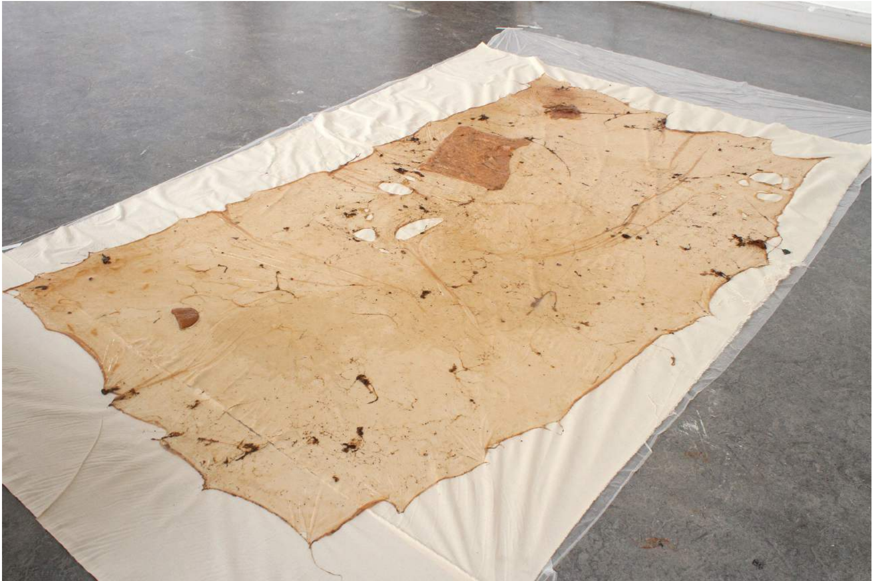
Utplattad och torkad biofilm.