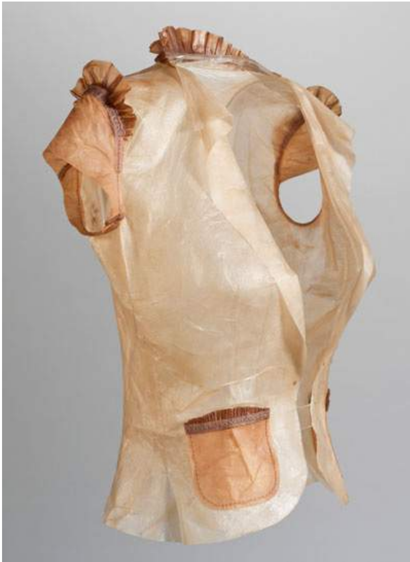
Suzanne Lee.