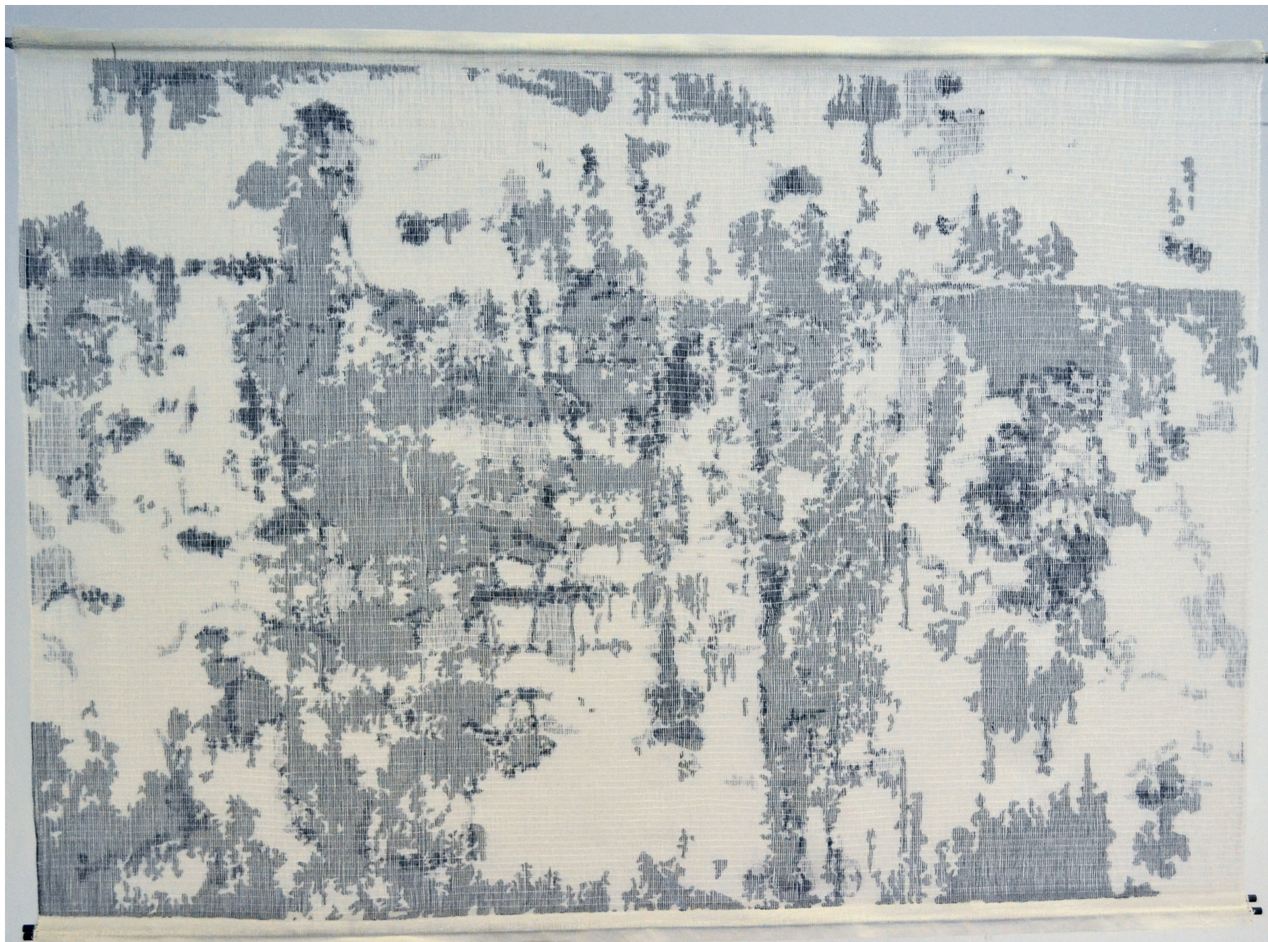
Helbild på verket, två vävar sammansatta till en.