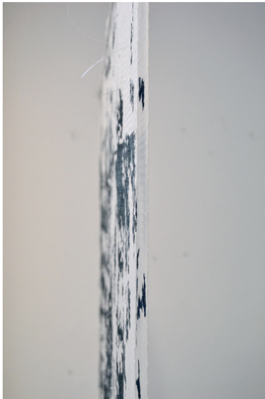
Detaljbilder på väven, visar vävstruktur och den dubbla sammansättningen.