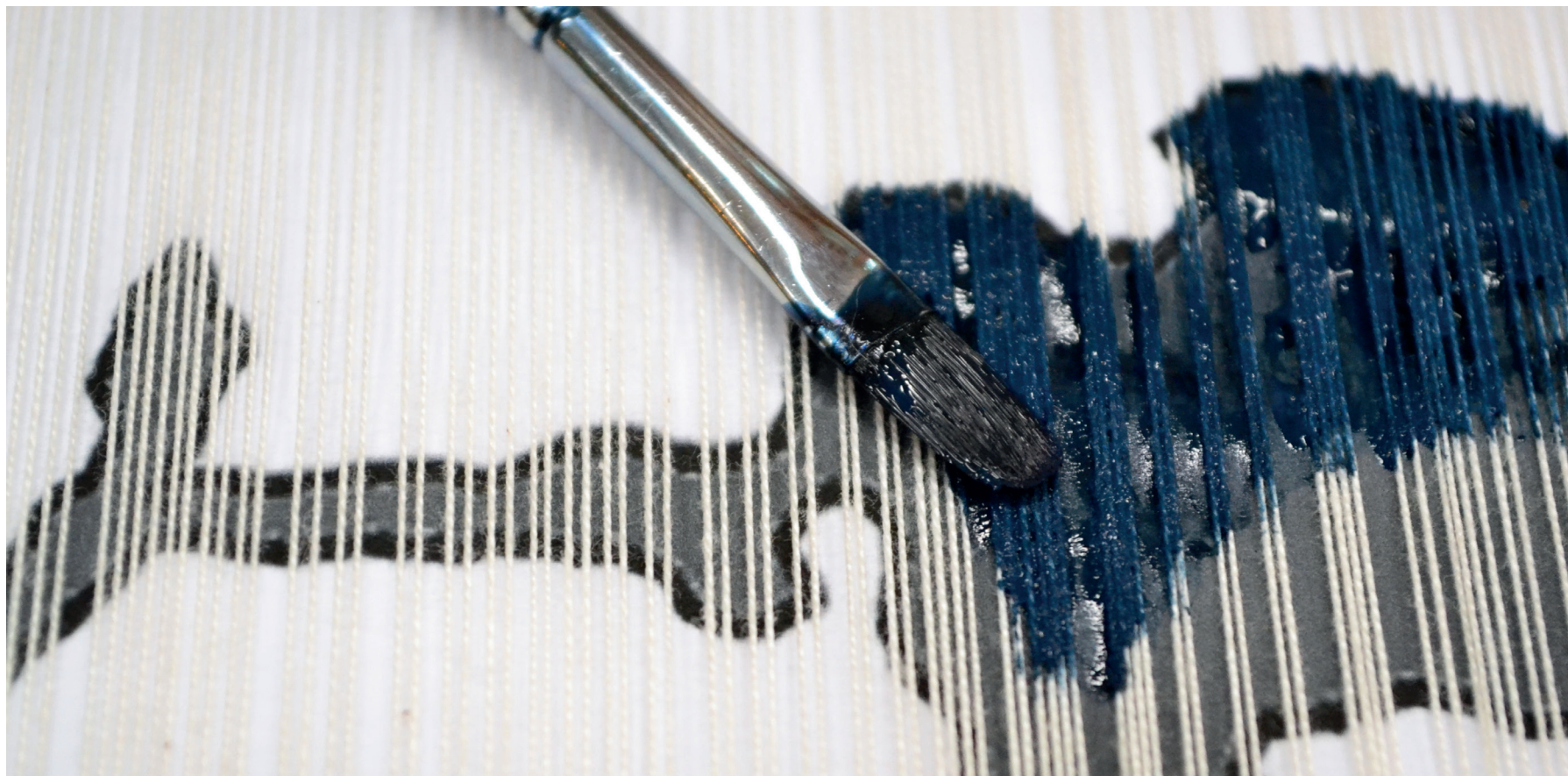
Detaljbild på målningen av varpen.