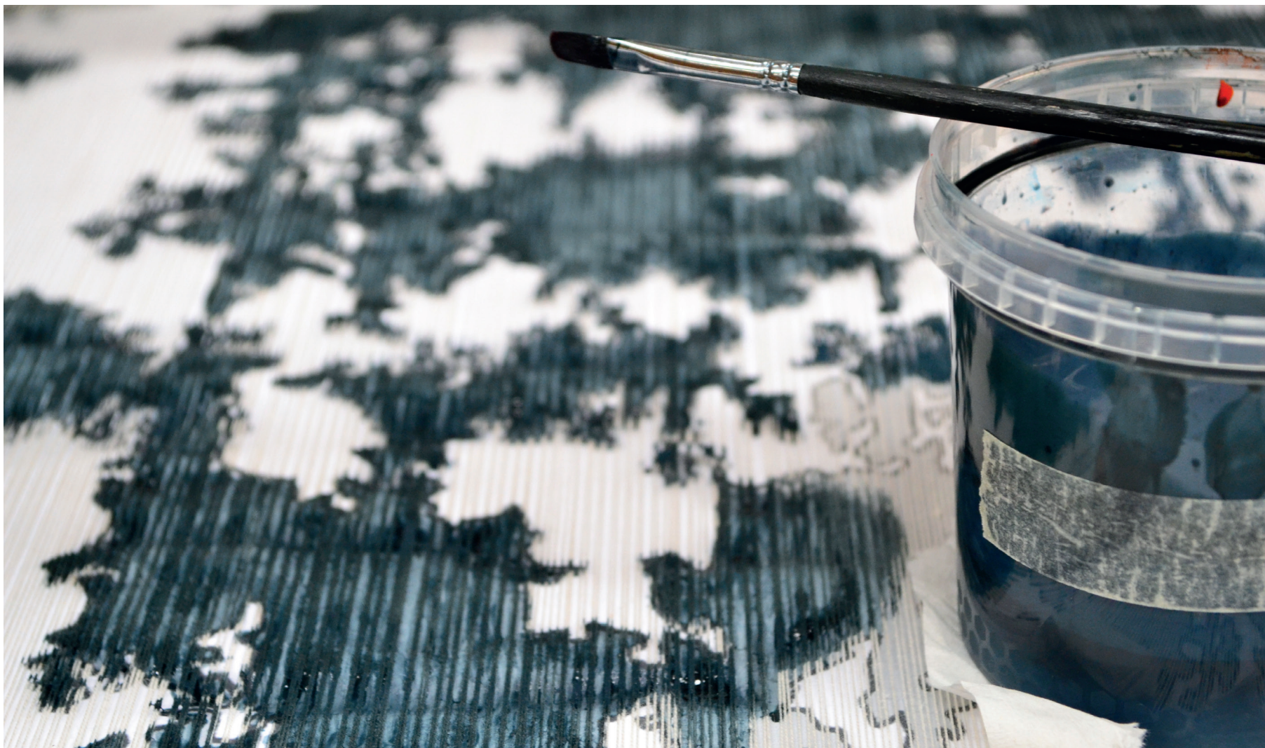
Detalj fotografi på varpen, under målningsprocessen. Man kan skymta schablonen under trådarna.