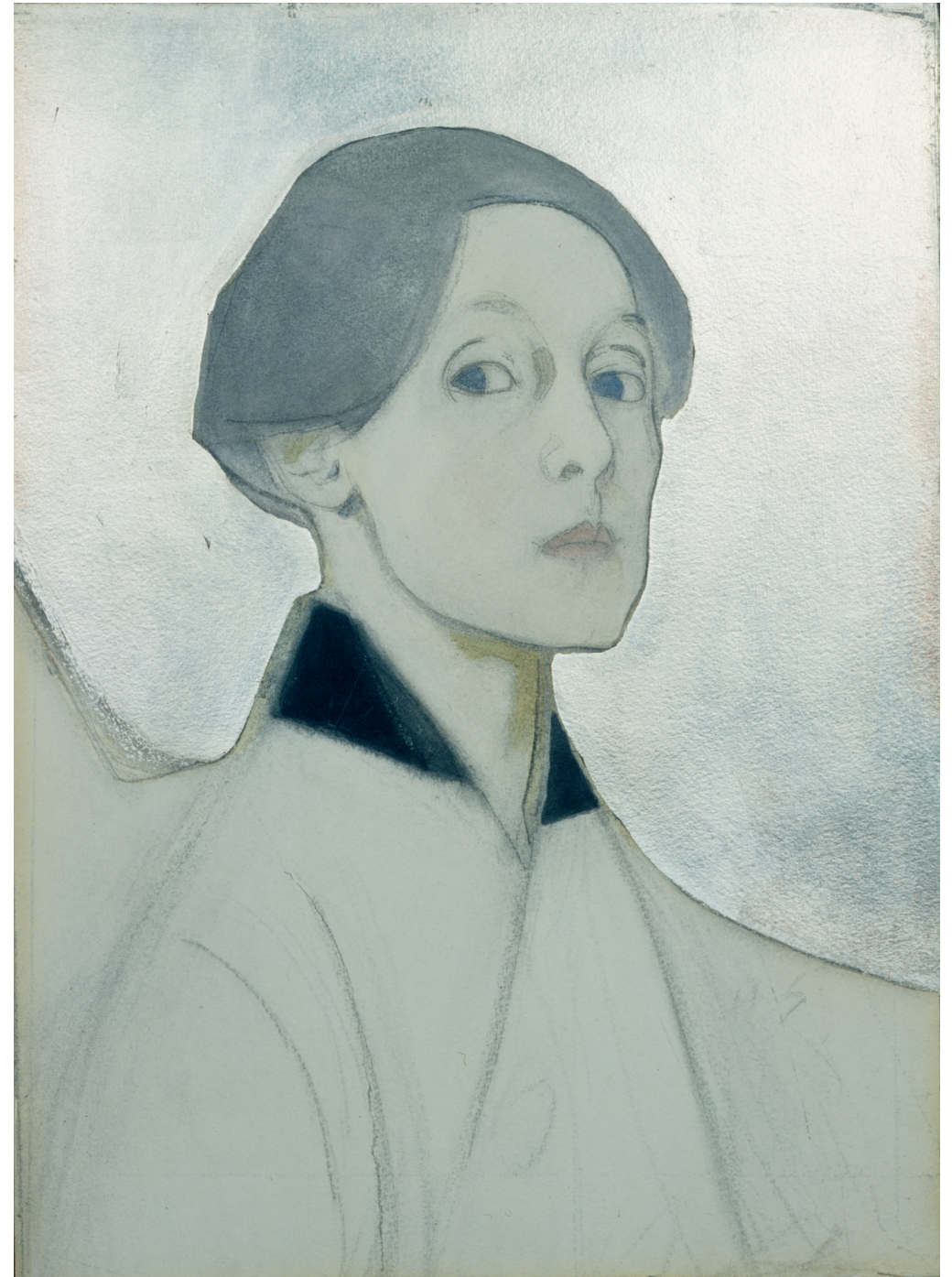
Helene Schjerfbeck Self-portrait with silver background , 1915