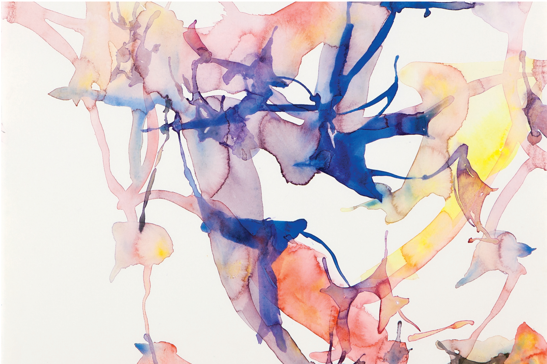
Bernd Koberling Blommande melankoli (6) , 2008 Foto: Nordiska Akvarellmuseet