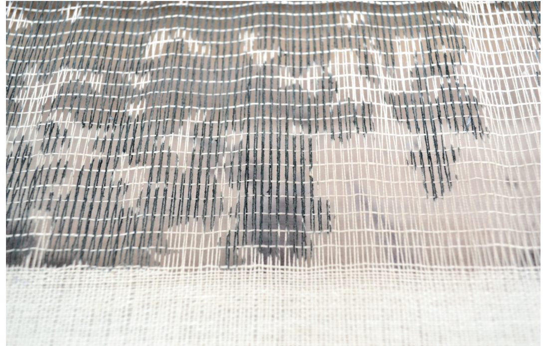
Detalj fotografi på vävprocessen. Överst: målad varp Underst: målad och vävd