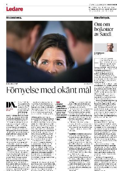
Figur. 10. DN ID-2

En tydligt förminskande bild som samtidigt är intressant ur ett genusperspektiv är en bild från DN där AKB är beskuren vid näsan och ses blicka upp mot två män i förgrunden. Bilden är tagen i en vinkel där hon trots sin längd hamnar i underläge till männen och tittar frågande upp på dem. Bilden förminskar och förlöjligar AKB både som politiker och ur ett genusperspektiv.