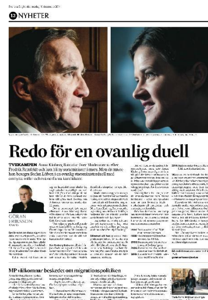
Figur. 6. SvD ID-2

I artiklarna finns totalt sett väldigt lite ethosbetonat material, även om vi kommer presentera en del sådant under text- och bildanalyserna. I några enstaka presenteras opinionsundersökningar som skulle kunna användas för att bygga AKBs ethos, men då siffrorna är relativt låga jämfört med de