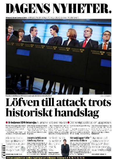
Figur. 3. DN ID-14

Det går att se visuell framing i bilder föreställande presskonferensen om Decemberöverenskommelsen där AKB ses torna över Stefan Löfven. Artikeln förminskar snarare Löfven och de Rödgröna än AKB men de använder henne för att skapa vissa ramar och förstärka delar av händelsen (Rodriguez & Dimitrova, 2011:52). Bilden från presskonferensen förekommer i olika versioner i alla tidningarna och är typisk för den undersökta perioden och inne i tidningen vid en artikel. AKB står i mitten och tittar på Löfven med lite framåtlutat huvud.