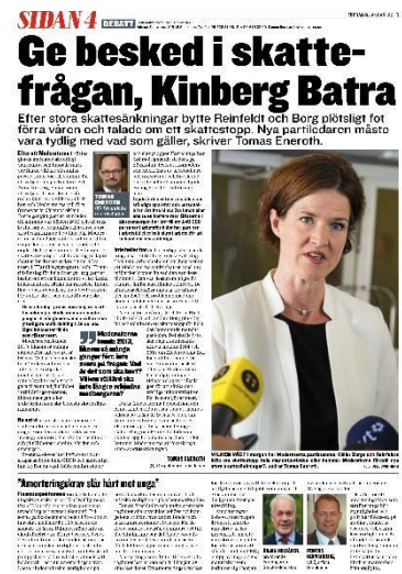
Figur. 4. Expressen ID-36

Rubriken kräver att AKB ska ge svar om skattefrågan. Själva artikeln behandlar Moderaternas historia vid makten och ställer sig frågande till vad AKB kommer bidra med som ledare. Texten är stundtals negativ och ställer AKB till svars, utan att låta henne komma till tals. Bilden förstärker känslan av att AKB inte har något klart svar på frågan då hon ser ställd ut på bilden. Texten tillsammans med bilden förminskar AKBs position.