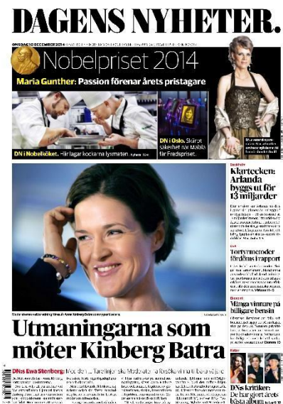
Figur. 9. DN ID-1

En annan bild som vid ett första ögonkast inte verkar vara genustypisk är en stor bild på tidningens framsida där AKB ses leende. Hon ser glad, men samtidigt lite generad ut, vilket förstärks genom att hon för handen till ansiktet. I texten får vi reda på att hon precis blivit nominerad till Moderaternas nya partiledare vilket då förklarar varför hon ser så glad ut. Men frågan är om samma typ av bild hade valts om det var en man som blivit nominerad. Skulle en sådan bild på Reinfeldt ha publicerats när han nominerades? I Jarlbro och Hammarlins bok Kvinnor och män i offentlighetens ljus beskrivs det att vissa bilder inte anses problematiska förrän personerna byts ut till män (2014:70). Denna bild går i linje med detta. Det är ingen uppenbar genuskoppling men tänker man en vända till så går det att se mönstret. Som kvinna porträtteras hon som generad och lite fnissig över att fått nomineringen, vilket inte ger några konnotationer till ledarskap eller kompetens som man skulle förvänta sig av en blivande partiledare.