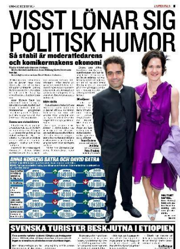
Figur. 7. Expressen ID-8

De bilder där AKB förekommer i privata situationer kan också förklaras och kopplas till personifiering. Att porträttera henne i sociala situationer med sin man sätter AKB i ett annat ljus och blir mer lättsamt än i politiska och allvarliga situationer. Det kan då bli lättare för läsarna att identifiera sig med henne vilket kan öka intresset för andra artiklar som har AKB i bild och text (Hvitfeldt, 1983:42).