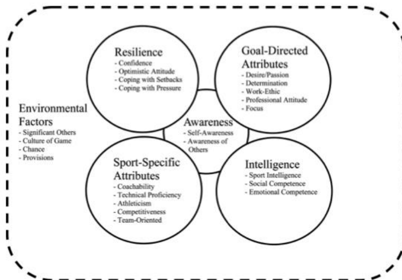
Figur 1. Faktorer som påverkar unga spelares utveckling, enligt Mills et al. (2012)

Det har tidigare bedrivits en del forskning på selekteringsprocessen och spelares utveckling i fotbollsakademier. Egenskaper som har beskrivits som särskilt viktiga för en spelares utveckling, och som därför ses som önskvärda för spelare i selekteringsprocessen är medvetenhet (awareness) både om en själv och ens egen utveckling, samt vilka krav som ställs och om andra som är delaktiga i ens utveckling; motståndskraft (resilience), det vill säga en kombination av självförtroende, hantering av press och misslyckanden; målmedvetenhet (goal-directed attributes), som passion, bestämdhet, arbetsmoral, professionell attityd och fokus; intelligens (intelligence), där social kompetens, emotionell kompetens och spelförståelse är inkluderade; idrottsspecifika attribut (sport-specific attributes), bestående av träningsbarhet (coachability), teknisk förmåga, atletisk förmåga, samt tävlingsmentalitet; och slutligen miljöfaktorer (environmental factors), det vill säga betydelsen av signifikanta andra, som föräldrar, syskon eller lagkamrater, idrottskultur, samt andra externa förutsättningar (Mills, Butt, Maynard & Harwood, 2012).