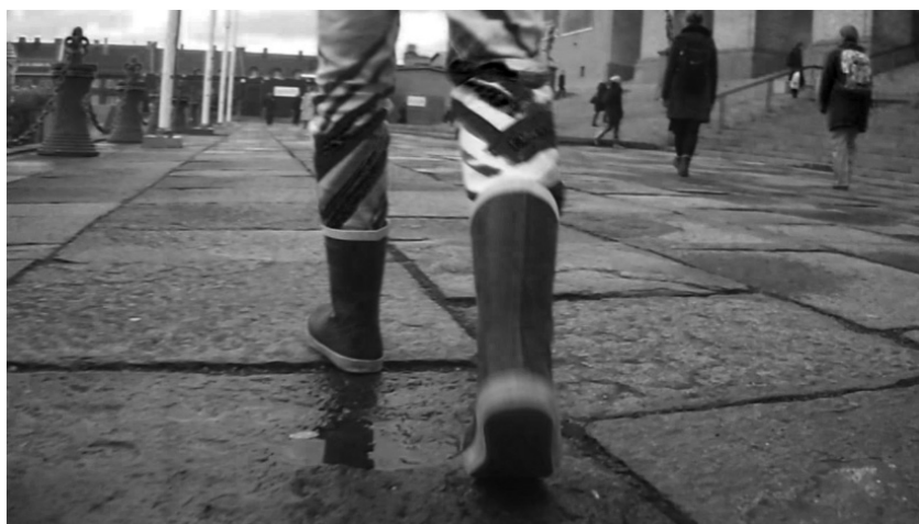
Workshop på Götaplatsens trappor den 29 Oktober 2013 (foto: Linda Sternö).

Det första registret, som är det som den här texten främst tar sig an, fokuserar på det jag kallar för scenografisk sinnlighet .