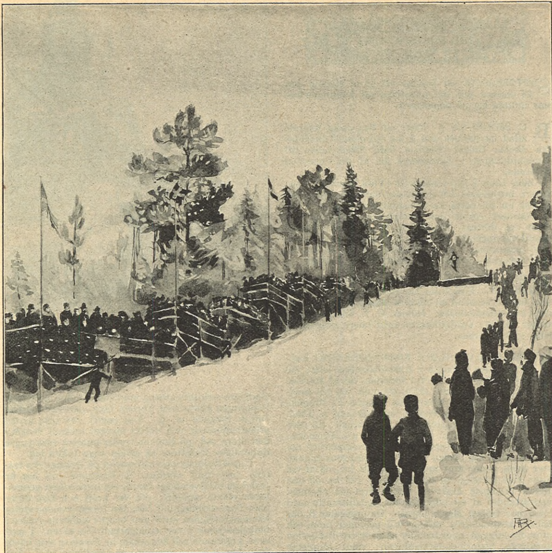
SKIDTÄFLINGARNA PÅ SALTSJÖBADEN DEN 4 DENNES. EFTER EN TECKNING AF ALGOT RINGSTRÖM.

mera aldrig besvär med att taga i något slags beaktande, hurvida det fanns fog i fruns anmärkningar, utan allt dömdes öfver en bank: »omöjligheten att göra frun till lags».