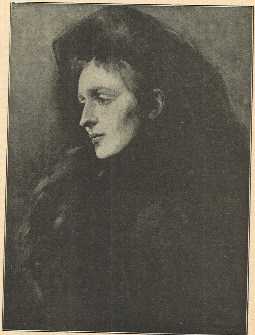
»DAM I SVART.» EFTER ETT OLJEFÄRGSPORTRÄTT AF HILDEGARD THORELL.

Det är med ett ord en vacker och intressant