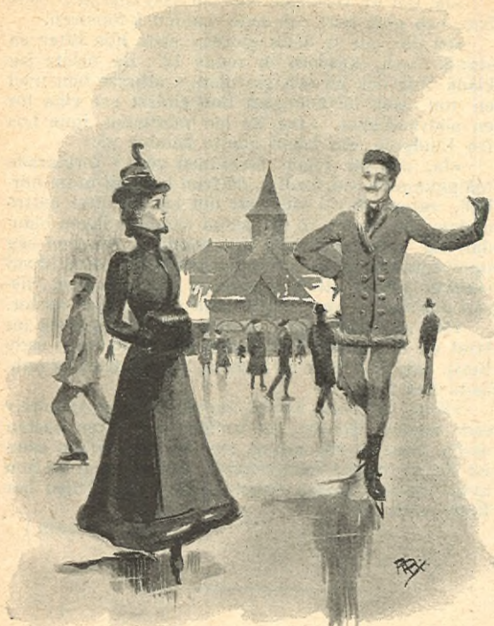
SKRIDSKOBANAN I IDROTTPARKEN.

mynt. Också skola alla brudparets släktingar, vänner och bekanta ha sin lilla bit med af tårtan, och till de icke närvarande sändas deras andelar långa vägar pr post. Själva toppen, krönet på den praktfulla pjäsen, förvaras af bruden själf till döddagar