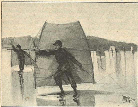
SKRIDSKOSEGLING PÅ BAGGENSFJÄRDEN.

mynt. Också skola alla brudparets släktingar, vänner och bekanta ha sin lilla bit med af tårtan, och till de icke närvarande sändas deras andelar långa vägar pr post. Själva toppen, krönet på den praktfulla pjäsen, förvaras af bruden själf till döddagar