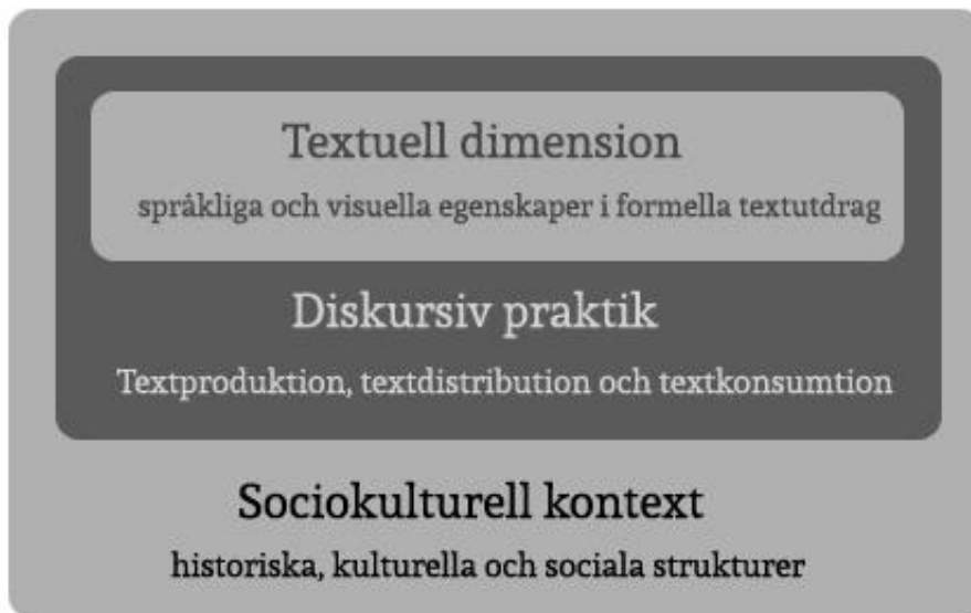
Figur 1. Faircloughs tredimensionella diskursmodell (Watt, 2007).

Sammanfattningsvis finns många definitioner av diskursbegreppet och många olika perspektiv på både diskursteori och diskursanalys (Watt, 2007). Studien utgår från diskursanalysen med inspiration av både Faircloughs kritiska diskursanalys, som är den diskursanalys som är främst inriktad på den sociala kontextens betydelse för hur texter används och tolkas, och Treem & Bernardis ramverk för affordances. Med hjälp av Faircloughs tredimensionella modell ska alltså studiens frågeställning kring vad som skrivs besvaras. Det tekniska ramverket av affordance tas även i anspråk för att svara på studiens andra frågeställning, alltså vilka tekniska egenskaper som påverkar ryktesspridning i social media. Studien utgår från att språket i de texter som analyseras fungerar som ett medium genom vilket verkligheten skapas och struktureras (Sveningsson et al, 2003). Jörgensen & Phillips (2002) menar att man med fördel kan dra in andra inriktningar när man arbetar utifrån Faircloughs teori. Följande kapitel ämnar ge en djupare presentation av det diskussionsforum som analyserats.