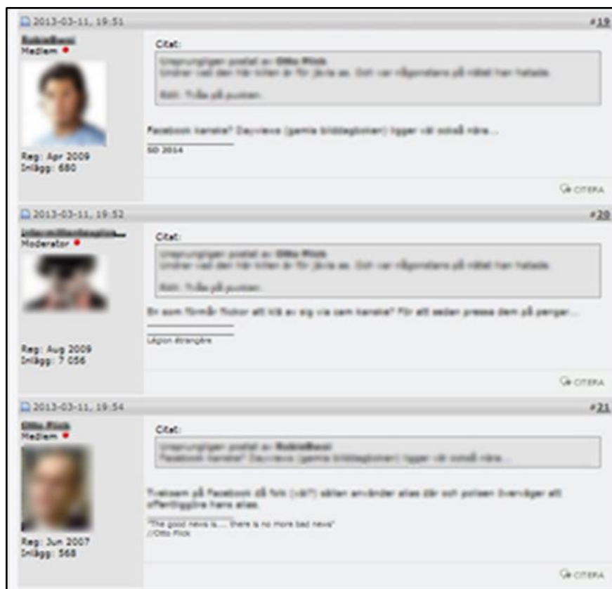
Figur 3. Inlägg i diskussionstråd på Flashback Forum (flashback.org) (text har suddats ut för att inte avslöja användarnamn och text)