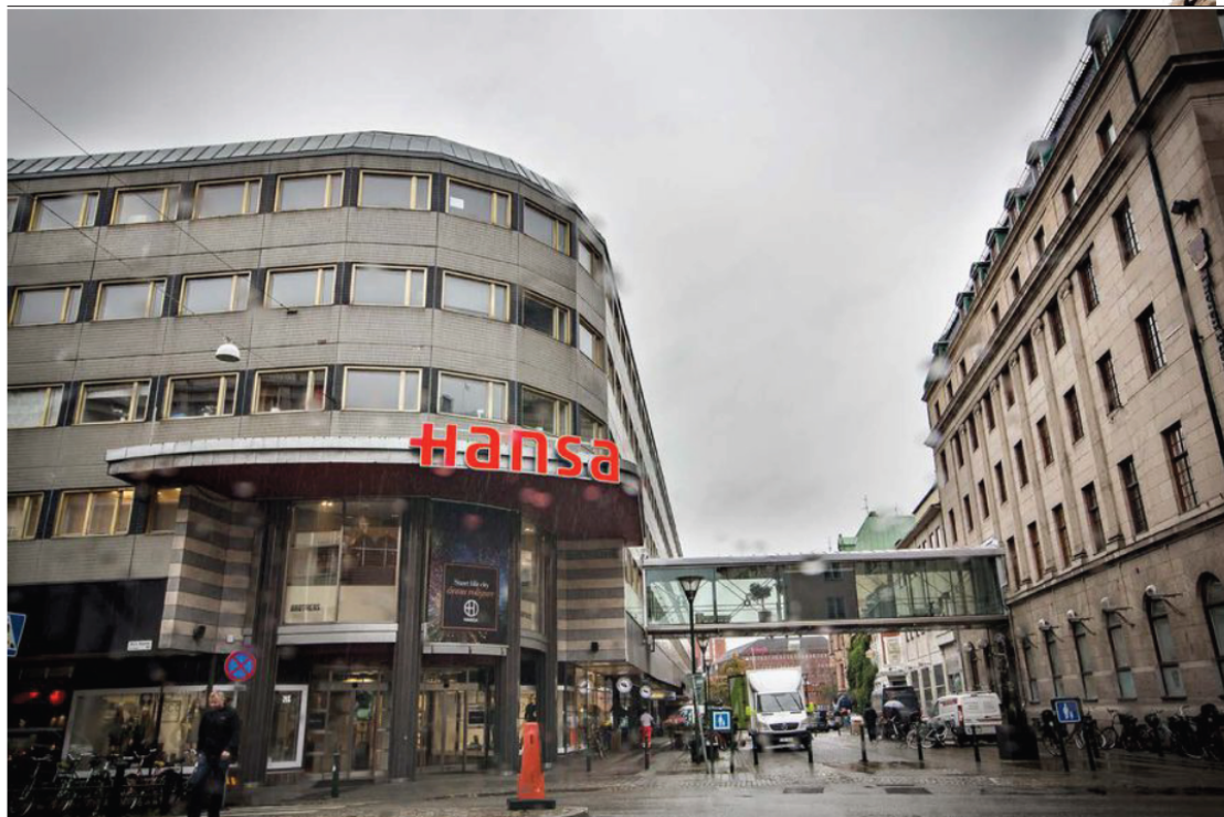
På en toalett i Hansagallerian i Malmö dog den funktionshindrade kvinnan från Vellinge. Vi måste kunna förvänta oss mer av våra politiker i handikappolitiken, anser skribenten.

Debattredaktör (vsk): Henrik Bredberg aktuell@sydsvenskan.se 040-28 10 13 Twitter: @aktuell Fler debattartiklar på sydsvenskan.se/opinion