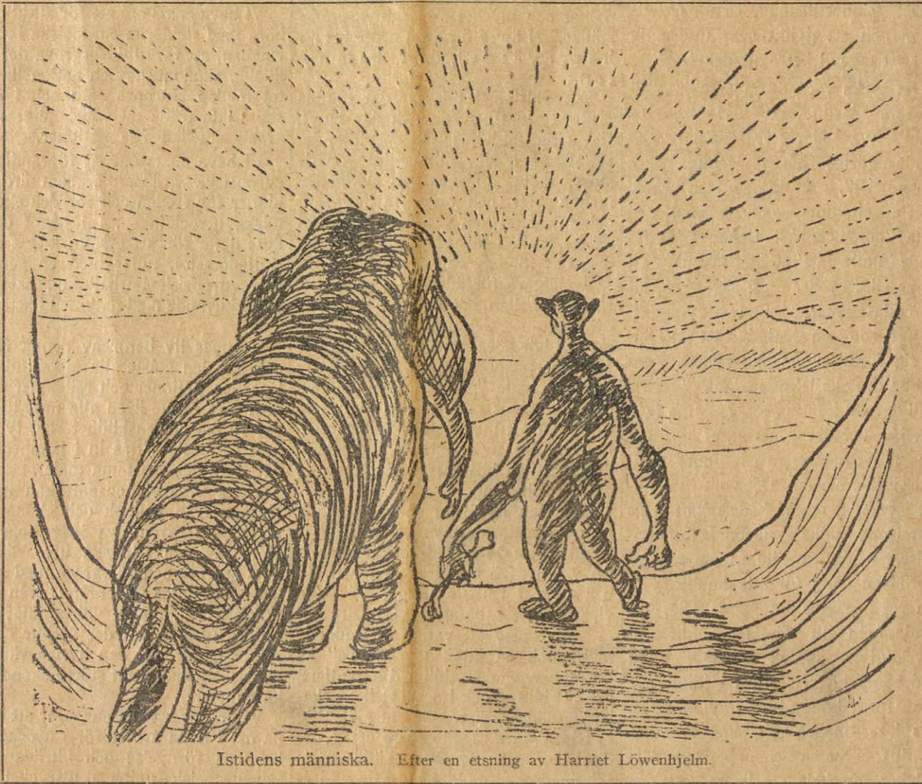
Istidens människa. Efter en etsning av Harriet Löwenhjelms.

O jord, som stiger tvagen ur alidande isars bad! Han kommer, den stora dagen, om vilken staren kvad.