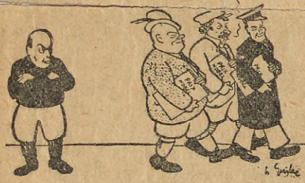
Stresemann, Briand och Chamberlain vandra glada med sina fredspris. Mussolini: Nå men jag då?