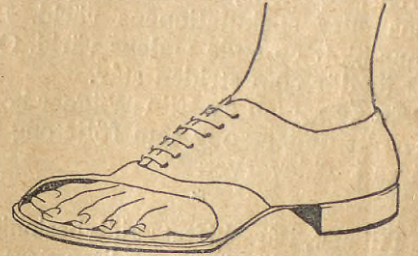
Så lediga skall tårna ligga i skon.