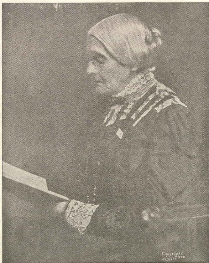
SUSAN B. ANTHONY