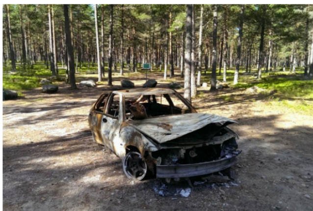
Den här bilen har sedan i maj stått utbränd vid Falks grav, utanför Habo.