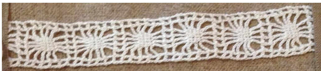
Fig. 9. P2-13 Mellanspets.