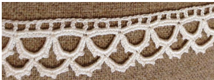
Fig. 11. P2-58 Uddspets tränsad virkad på längden.