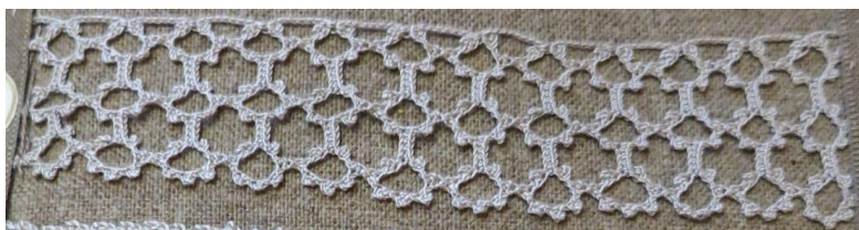
Fig. 14. P2-79 Uddspets med blommönster.