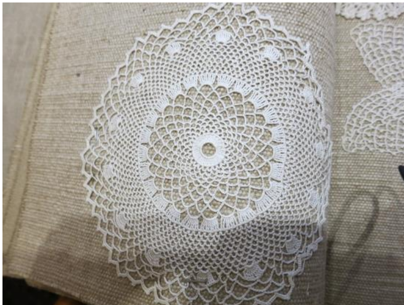
Fig. 4. P1-38 Rundvirkad spets.