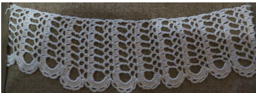
Fig. 10. P2-53 Uddspets.