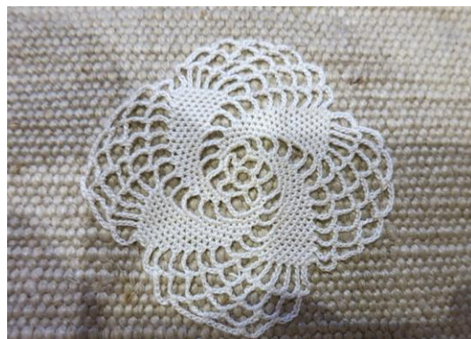
Fig. 3. P1-36 spiralformad spets.

P1-36 Spetsen är virkad med ljust garn. Den är rundvirkad med fasta maskor och luftmaskbågar bildar en spiralform. Liknande mönster finns i prov från Gerda Björk (Björk 1944, s. 17) och i Haekling historie og teknik (Paludan 1986, s. 61).