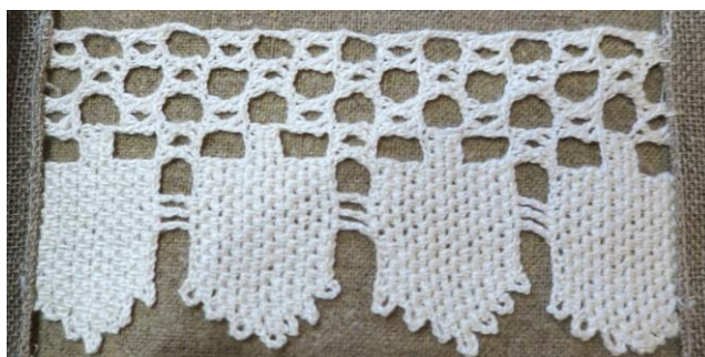
Fig. 16. P2-108. Uddspets med inspiration från knyppling.