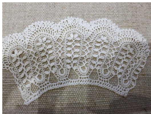
Fig. 2. P1-30 Spets med mignardiseband.

P1-30 Spetsen är virkad med ljust garn. Mignardiseband med picoter används för att skapa spetsens uttryck. Spetsens mönster är bladliknande och ett liknande mönster finns i Paludans kapitel om virkning med hjälpband. Mönstret i Paludans bok kommer från nordisk mönstertidning 1874 och 1876 (Paludan 1986, s. 299).