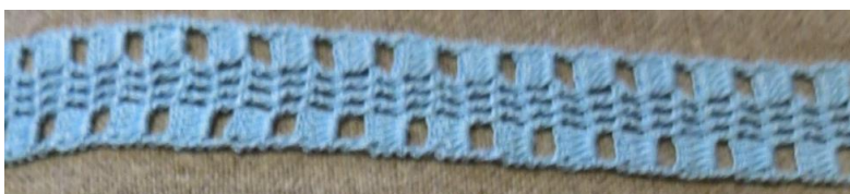
Fig. 13. P2-68 Mellanspets i blått.