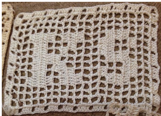
Fig. 15. P2-103 filévirkad spets med monogram.