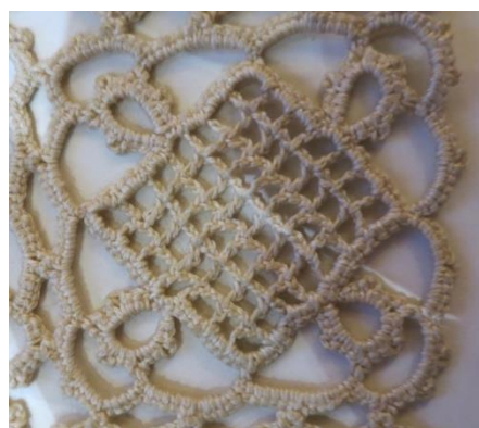
Fig. 7. P3-01 Bohusstjärnan rund luftmaskbåge.