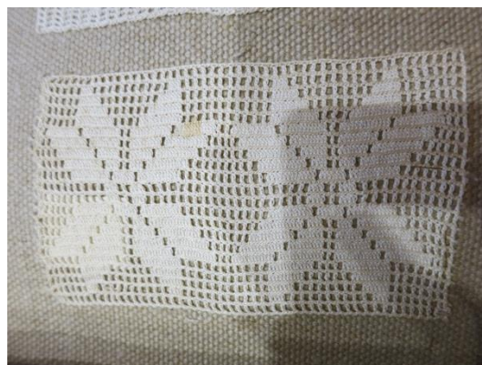
Fig. 1. P1-10 Filévirkad spets.

P1-10 Spetsen är virkad i ljust garn. Den består av en filévirkad rektangel med mönster som påminner om blommor. Liknande blommönster finns representerade i Björks samling (Björk 1944, s. 27 Bild 15).