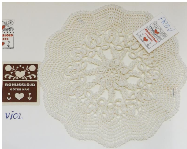
Fig. 21. P3-9 rundvirkad spets Viol.