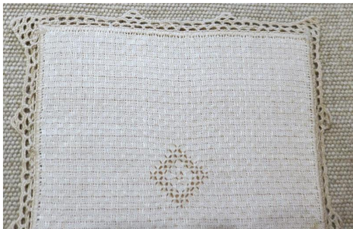
Fig. 8. P3-73 Vävd duk med virkad kant.