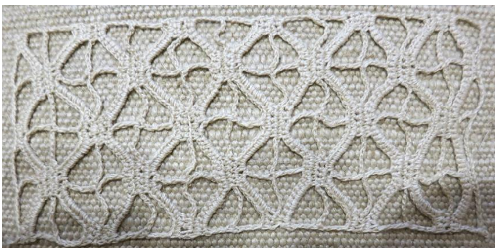
Fig. 5. P1-42 Spets virkad fram och tillbaka.