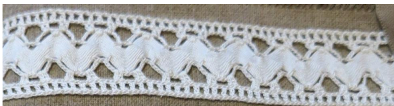
Fig. 12. P2-60 Mellanspets med ganserbånd.