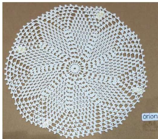
Fig. 19. P3-9 rundvirkad spets Orion.

Spetsen är virkad i ljust garn. Det är en rundvirkad tablett som består av stolpar och luftmaskor. Längst ut finns picoter. Stjärnan har 9 uddar. Mönstret är namngivet Orion.