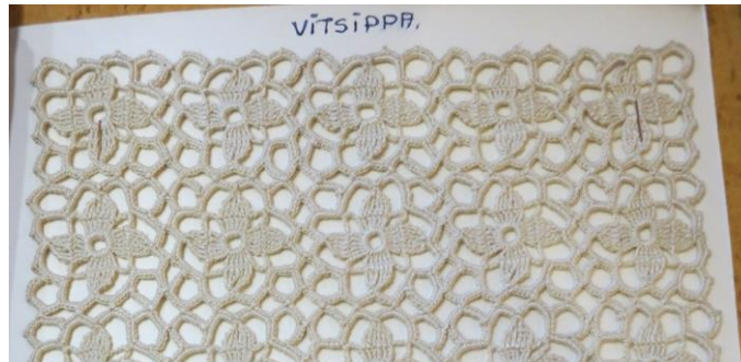
Fig. 18. P3-2 rundvirkad spets Vitsippa.

Spetsen är virkad i ljust garn. Rundvirkade rutor med blommor i mitten av stolpar som omges av luftmaskbågar som träsas. Rutorna monteras under virkningen genom att picoter fästs i varandra. Spetsen har namnet vitsippa.