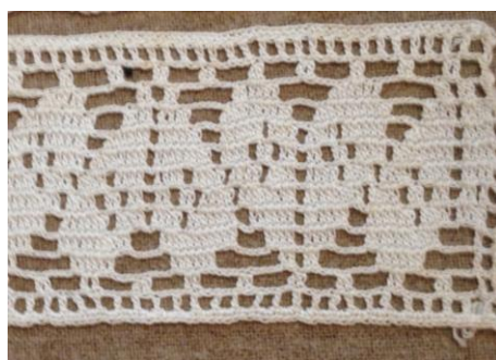
Fig. 17. P2-136. Mellanspets med hjärtan