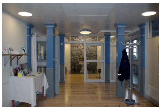
Bild nr. 6: Kyrkans entré leder in i ett kapprum. Rakt fram finns andaktsrummet. Dörren till höger leder in till gudstjänstrummet, och den till vänster till församlingsdelen.

Dörrarna till kyrkorummet är de ursprungliga, träpartiet i dörrpartiets överdel har dock bytts mot glas. Kyrkorummet har fått helt nya proportioner, men är i övrigt i stort sätt oförändrat. Församlingen valde att behålla bänkarna; några bänkar intill predikstolen i norr har dock kortats av 62 . Tillgängligheten har förbättrats genom installationen av en ramp upp till koret. Altarringen har kortats av och gjorts delbar. I kyrkorummet hålls under veckorna en låg temperatur,