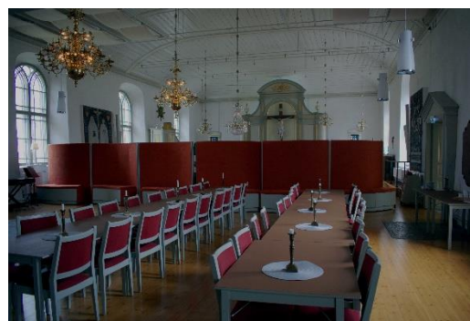
Bild nr. 3: Bord och stolar i församlingsdelen framställda inför barn- och caféverksamhet. De s.k. Örslösaskärmarna skymmer delvis koret.