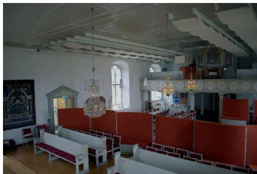
Bild nr. 2: Gudstjänstdelen av rummet betraktat från predikstolen. Fyra bänkar från den tidigare inredningen återstår. Bakom dessa är ett antal lösa stolar placerade. I taket syns de justerbara textilierna som reglerar akustiken.

Kyrkans kor förlängdes under ombyggnationen. Altaret och altaruppsatsen förflyttades på så vis längre bort från kyrkobesökarna. Den utökade ytan i koret ger större plats