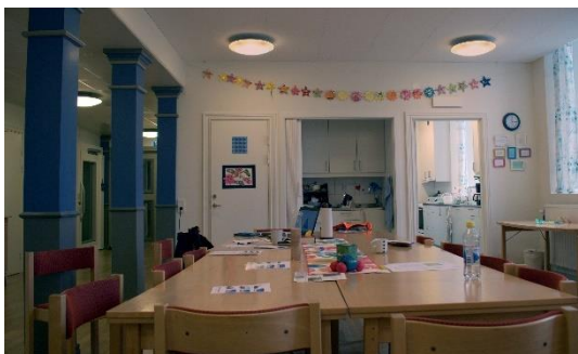
Bild nr. 9: Den öppna ytan fungerar som församlingssal. Till höger skymtas köket och till vänster den korridor som löper förbi kontorsutrymmena.