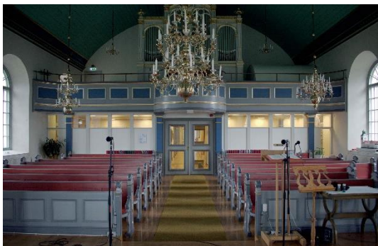
Bild nr. 7: Rummet för gudstjänst avskiljs från övriga långhuset med en fast vägg. Rummets proportioner har förändrats, men inredningen är i övrigt intakt.