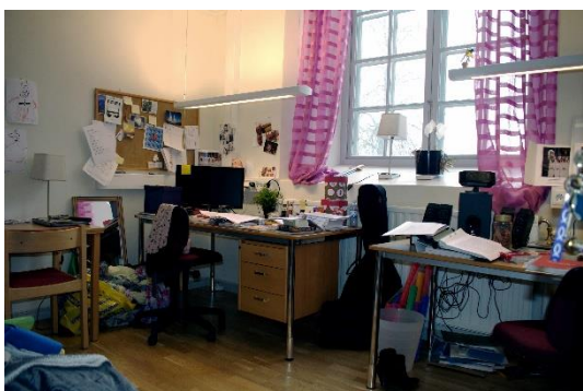
Bild nr. 8: Delat kontorsutrymme. Kontorsutrymmens är belägna i långhusets nordvästliga del.