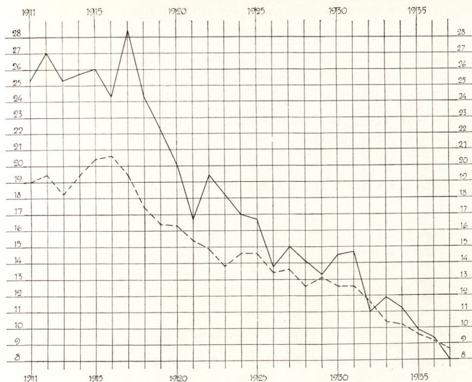
Tuberkulosdödligheten pr 10,000 invånare.

————— = Göteborg. - - - - - = Hela landet.