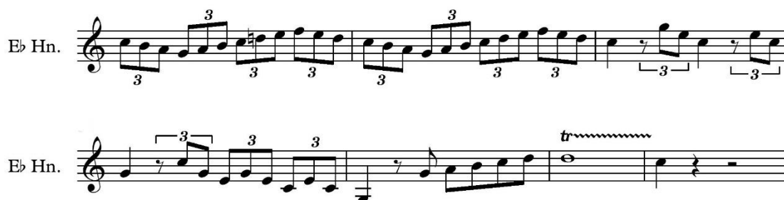
Exempel 17 Trioltema Mozart hornkonsert 3, takt 161-167

De två fermaterna leder in i en sekvens på sidotemat ( exempel 6, sid 11 ), varefter han spelar en egen figur som inte alls finns med i hornkonserten. Kadensen avslutas med en lång utbrodering på det allra sista noterade som händer i hornstämman i konserten, och landar efter ett arpeggio på den avslutande drillen.