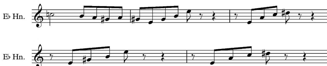
Exempel 16 Arpeggiotema Mozart hornkonsert 3, takt 103-107

Baboráks kadens börjar starkt, med en sekvens på huvudtemat ( exempel 5, sid 11 ) som är nästan exakt samma som Brain använder sig av. Efter det fortsätter han med en lång sekvens på en sextondelsfigur som förmodligen är menat att vara en referens till det som händer i sista slaget i fjärde takt av huvudtemat, takt 31. Denna sekvens leder in i ett nytt tema från konserten som han efter tre takter utvecklar i en lång variation som landar på två fermater.