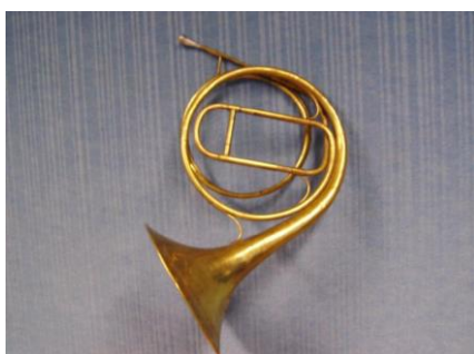
Bild 2 Naturhorn, utan ventiler

Eftersom man på ett naturhorn kan spela ett så begränsat antal toner finns det en särskild hand-teknik man använder sig av för att kunna spela fler toner. Det man gör är att man spelar med högerhanden inne i klockstycket på hornet och genom att öppna upp/stänga för öppningen på klockstycket kan man ändra tonhöjden. Handen har då tre grundlägen, det första är att man spelar ”öppet” med handen, man håller fortfarande handen i klockstycket men bara väldigt lätt för att inte påverka tonhöjden för mycket. De toner man kan spela då är dessa; det finns fler högre- och lägre toner man i teorin kan spela men det är otroligt sällan kompositörer använder sig av dessa då det blir för svårt. Audio 1 – Öppen naturtonsserie