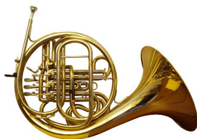
Bild 1 Modernt valthorn, med ventiler