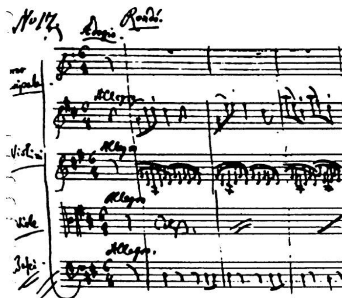
Bild 3 Öppningen till Rondo-satsen i Mozarts hornkonsert nr.1 i D-dur

Men trots att Mozart själv kanske inte såg sina fyra hornkonserter som några viktiga kompositioner har de kommit att bli en av grundpelarna i repertoaren för dagens hornister. Av dessa är den tredje hornkonserten den vanligaste och mest spelade, för de flesta hornister är det den första konserten de någonsin spelar. 8