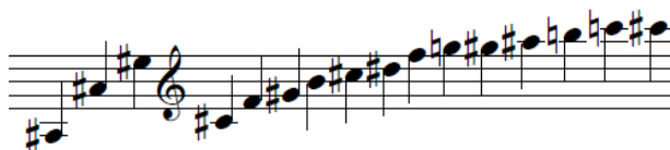
Exempel 4 Helstoppad naturtonsserie

Att spela helstoppat ändrar klangen på instrumentet väldigt mycket, och det är en teknik som har funnits kvar även efter att man uppfann ventilerna, en effekt många kompositörer fortfarande använder sig av. Audio 3 – Helstoppad naturtonsserie