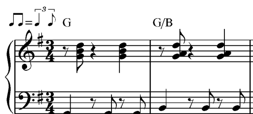
Exempel 7. Jazzvals.

När jag spelar jazzvals på piano kan det se ut som i Exempel 7. På slag ett kommer en kraftig baston följt av ett ackord på efterslag som spelas relativt lätt. Ackordet på slag tre spelas däremot starkare och betonat.