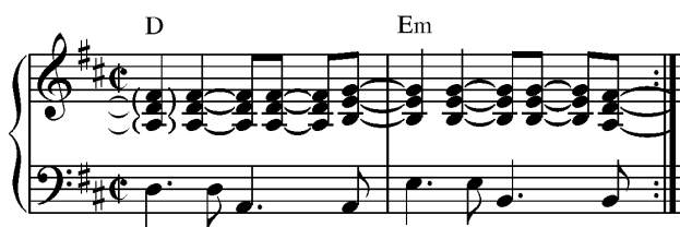
Exempel 2. Bossa nova.

Genom min musikaliska utbildning har jag lärt mig att bossa kan spelas på piano genom att vänsterhanden spelar växelbas (grundton och kvint om vartannat) medan högerhanden spelar ackorden i en speciell rytmisering (se Exempel 2).