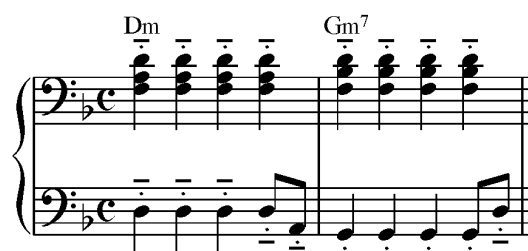
Exempel 5. Tangoinspirerat komp.