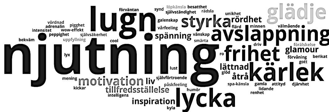
Figur 3. Ordmoln över känslor representerade i materialet, där ordens frekvens representeras av deras relativa storlek. n=110. För uträkningar se bilaga 4 tabell 6.

omskrivs explicit olika känslor 110 gånger i materialet och de flesta finns med en eller ett par gånger. I figur 3 visualiserar resultatet i ett ordmoln där ordens totala frekvens i materialet representeras av deras storlek.