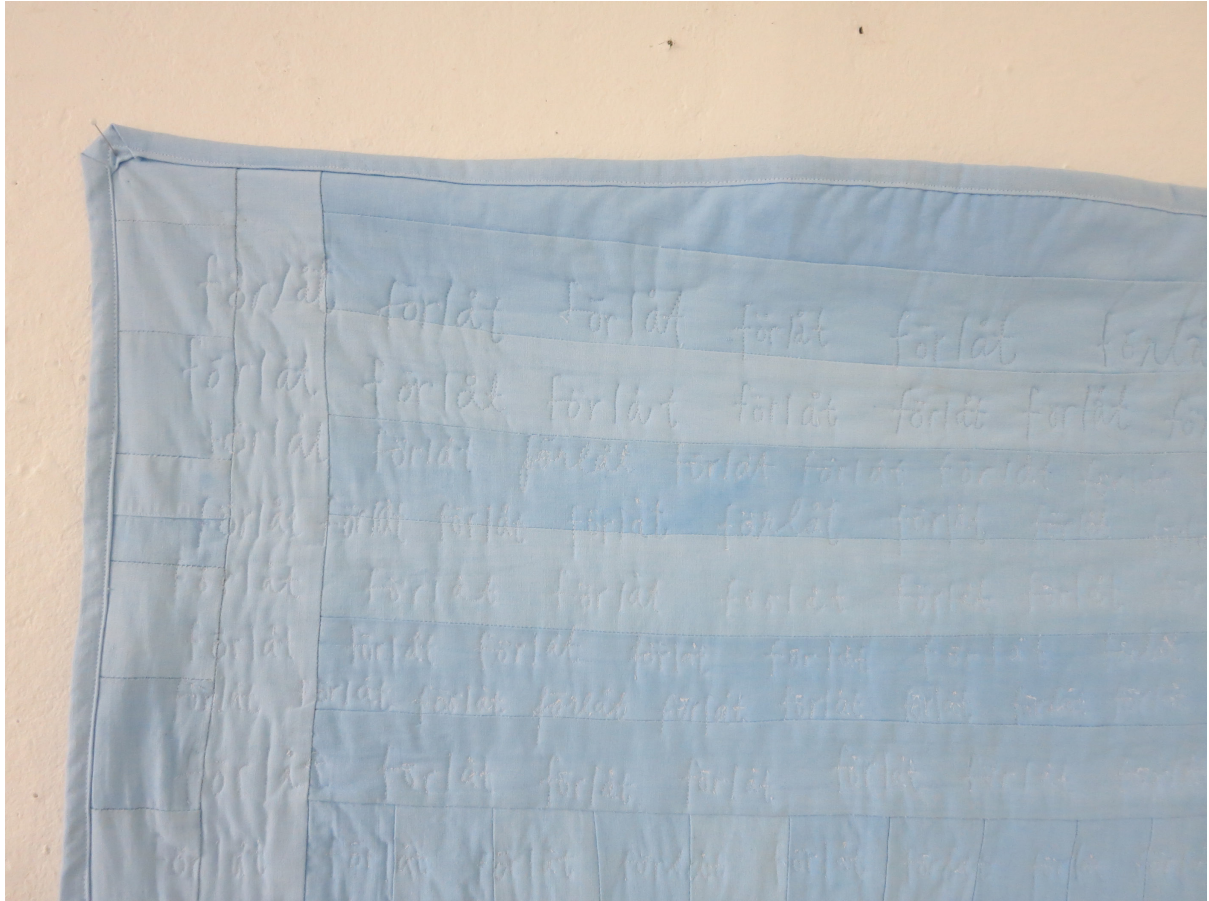
Förlåt (2016). Detalj ur ett tidigare verk.