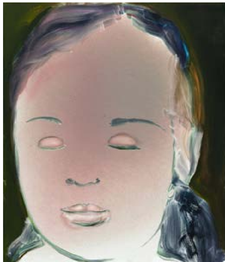
Helenas dream, Marlene Dumas 2008