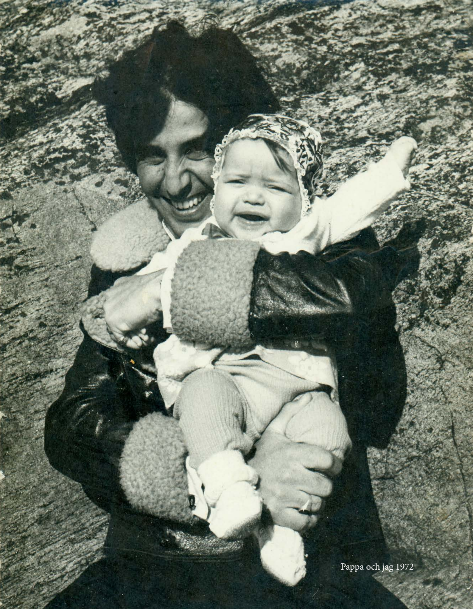
Pappa och jag 1972