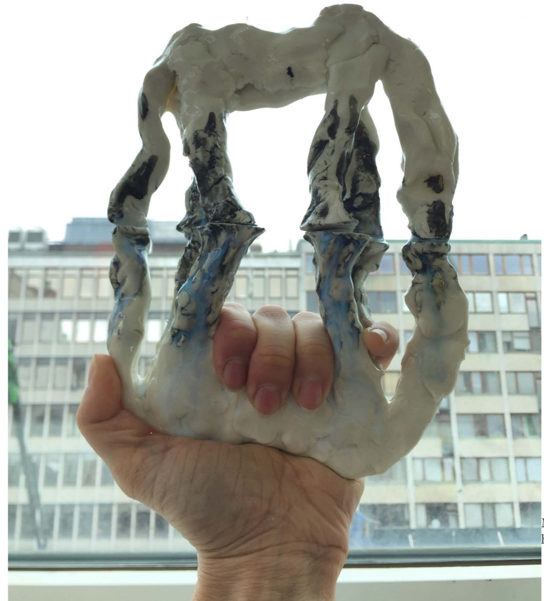
Målningen av hästen, fysisk i keramik

(Channel 4, All In The Best Possible Taste with Grayson Perry, June 2012)