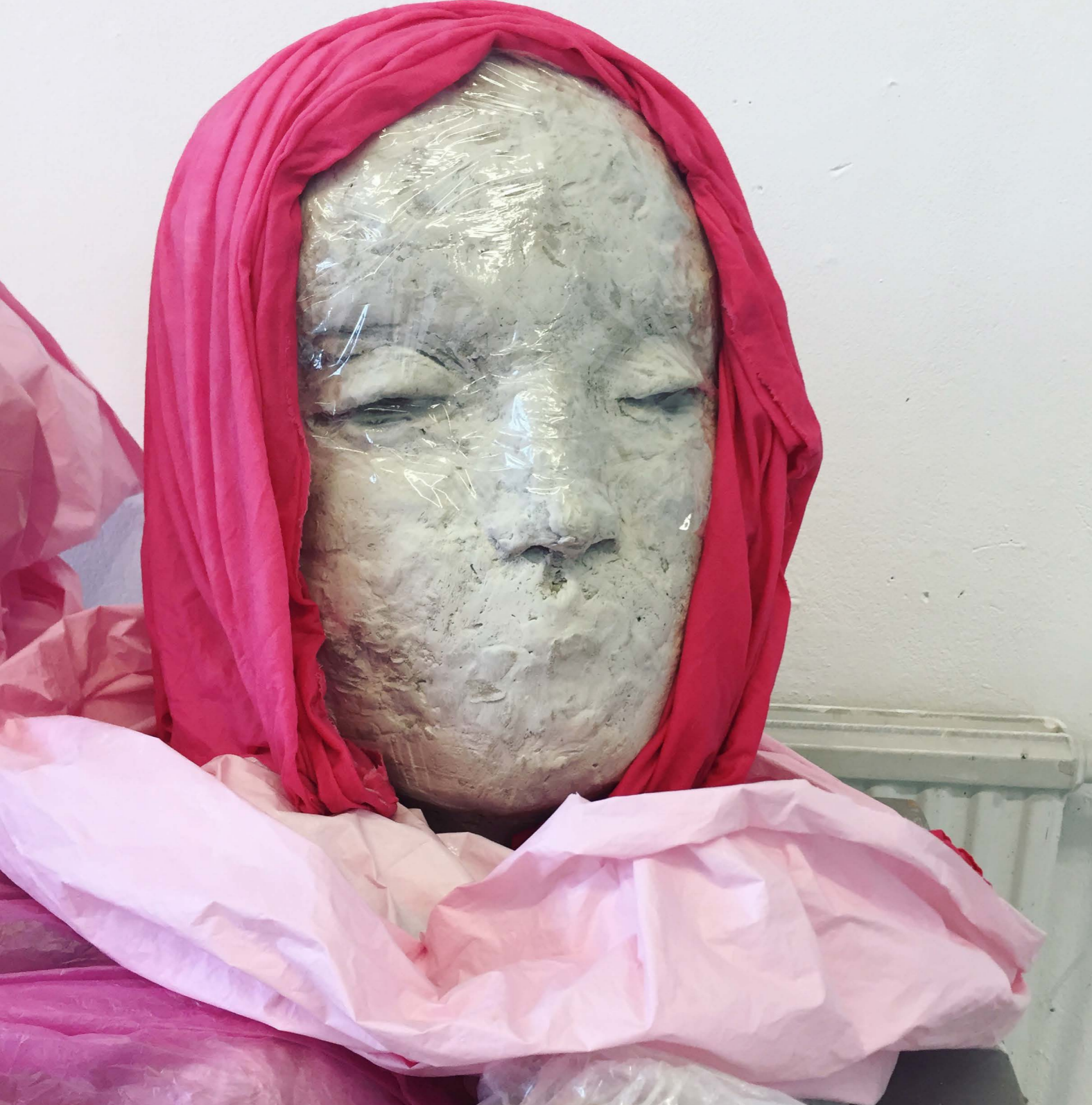
Kvinnohuvud som havererade pga för blöta trasor, och senare blev till huvud med snölykta.