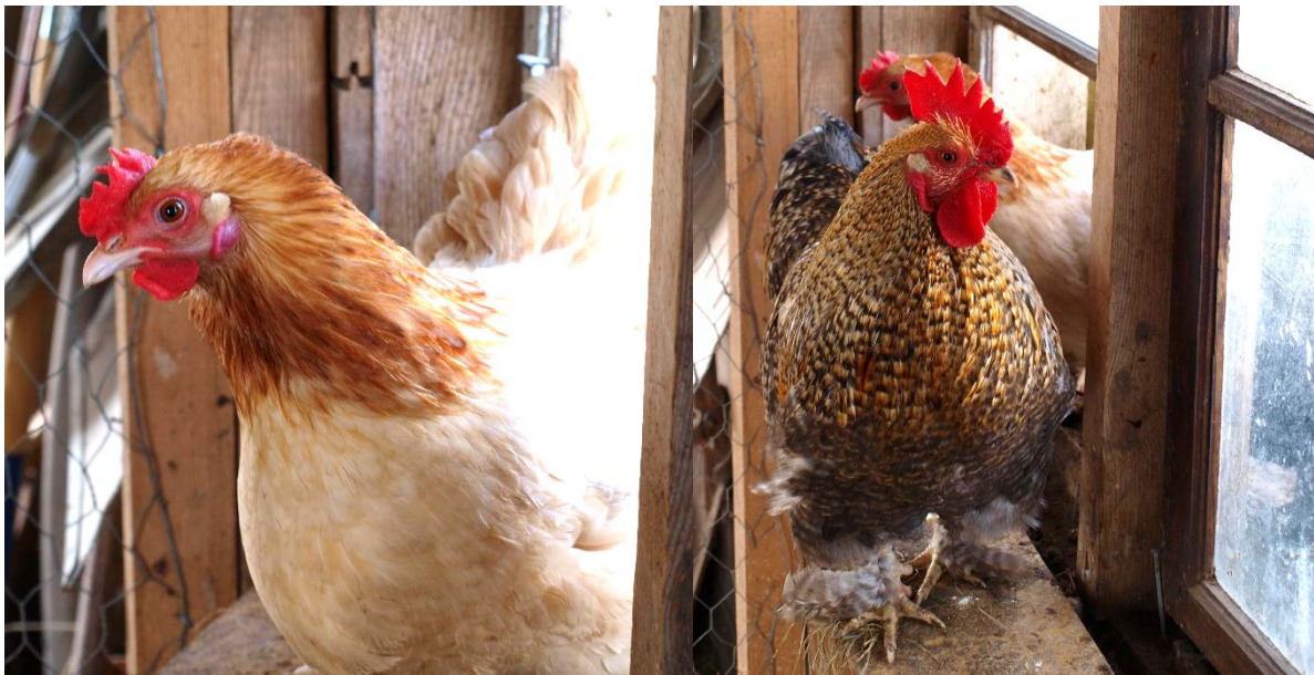
En höna och en tupp som nyfiket kommer in i hönsuset.

Den estetiska aspekten är viktig enligt mig, sen kan jag ju enbart utgå ifrån mitt eget tycke och smak. Hönsen själva vill nog mest ha det bekvämt, skyddat, rent och lagom varmt. Men jag tror att inomhusmiljön påverkar oss människor väldigt starkt. Därför kommer jag prova olika glasyrer och dekorer för att se vilka känslor de väcker hos mig. Dessutom vilken respons jag får från mina medstudenter och övriga medverkande under opponeringen av examensarbetet. Jag har inte sett något liknande tidigare, så det är svårt att veta hur andra hönsägare skulle vilja ha det. Det är något att utforska längre fram, också hur och om hönsen faktiskt bryr sig om vilken färg och yta redena har. Det roliga med att vara konsthantverkare är ju dels att det inte behöver vara en specifik färg eller form. Utan en kan anpassa sig både till sin egen vision, men också till den eventuella kundens. Genom att ha ett hönsred som är inspirerande, vill vi vistas där mer och vårda det bättre. På det sättet ökar även hönsens livskvalitet.