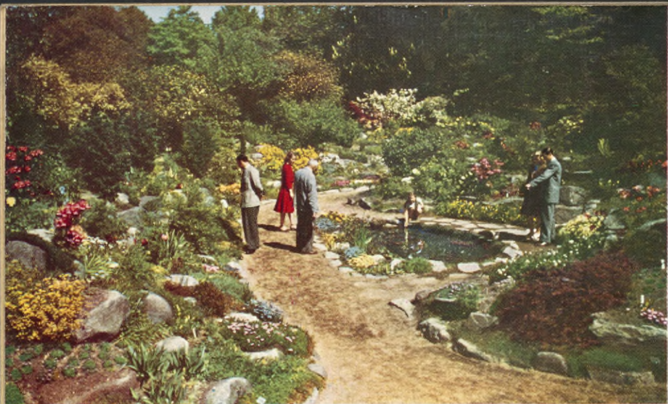
Vårflora i stenpartiet