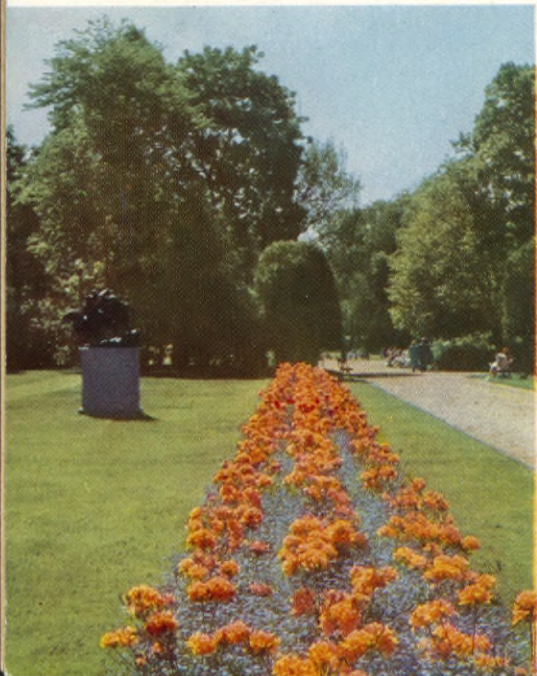
Azalea mollis och Förgätmigej