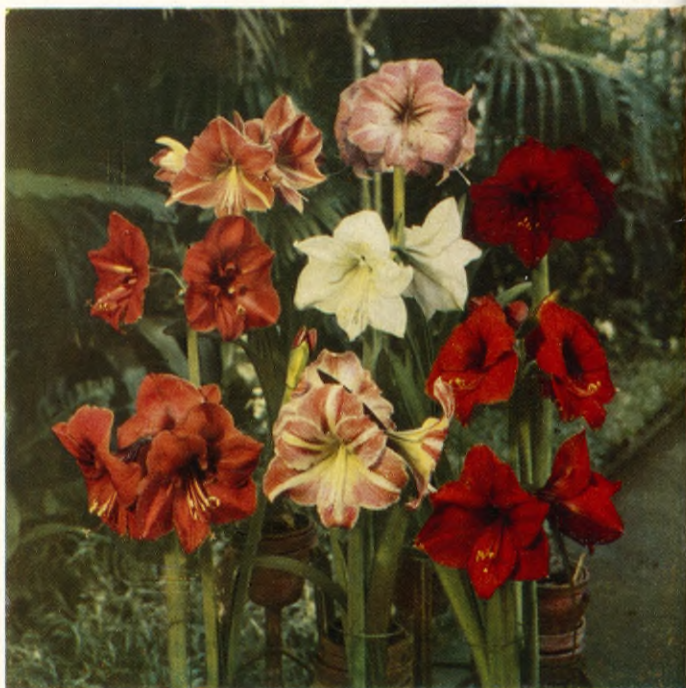
Amaryllis blommor i palmhuset