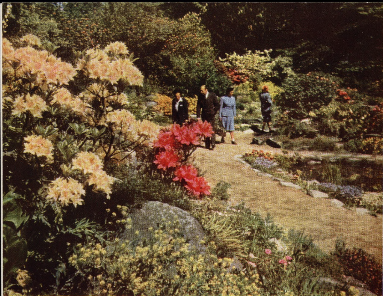
Vårflora i stenpartiet