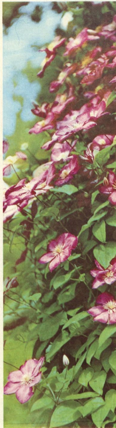
Clematis Ville de Lyon