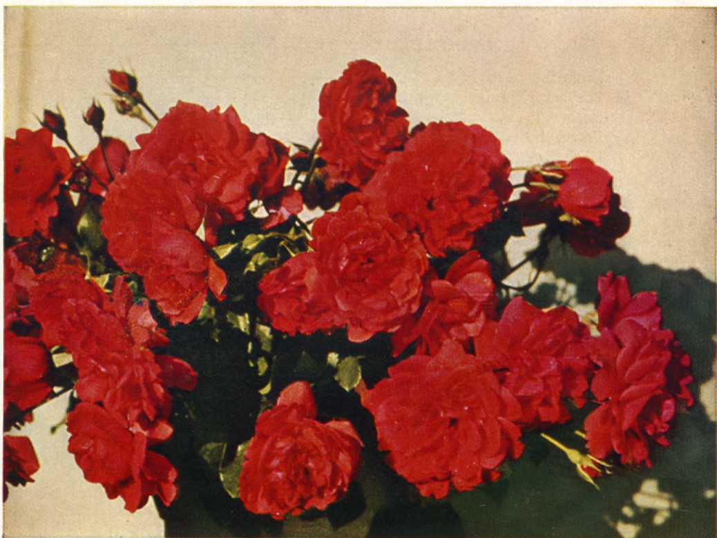
Nyhet NORDLICHT Nyhet