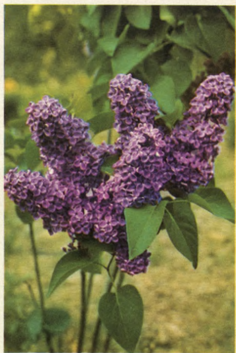
Syringa vulgaris Andenken an L. Späth