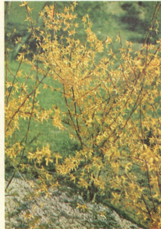
Forsythia intermedia spectabilis