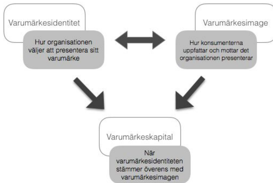
Figur: Uppfattning av modell gjord av författarna för studien.

Utifrån vald teori, Varumärkeskapital, har författarna för den här studien använt sig av en förekommande modell som kombinerar Aakers (1996) och Kellers (1998) teorier om varumärkesbyggande. Modellen visar på hur Varumärkesidentitet och Varumärkesimage är två byggstenar till Varumärkeskapital och förklaras i detalj i nedan modell.