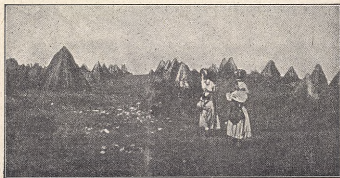
BY PÅ AGRO ROMANO.

Hon lever af att sy snörlif, men hur dessa andra fattiga kvinnor kunna ha något att betala henne med